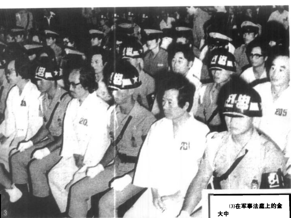
(3)在军事法庭上的金大中

新军部在政变过程中，对金大中阵营进行了最残酷的镇压。金大中及其身边的人在新军部实施在“5·17”扩大戒严措施的同时，被关进了汉城的南山中央情报部地下室，受到残酷的拷问，中情部长全斗焕还通过电视监视器观看了对金大中的审讯。