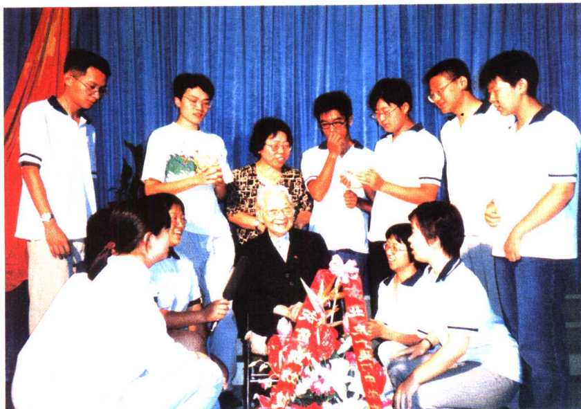
宏志班同学祝雷洁琼同志健康长寿