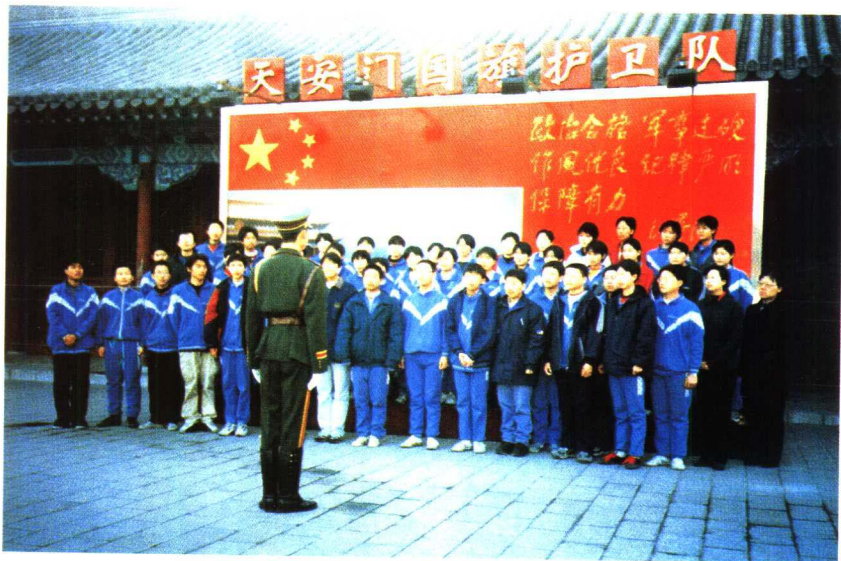
宏志班同学听国旗护卫队的战士讲国旗