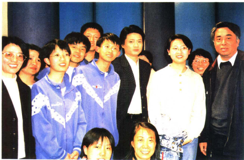
节目主持人崔永元与宏志班的老师同学们