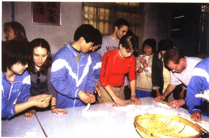
宏志班的同学们正在和来访的美国中学生一起包饺子。