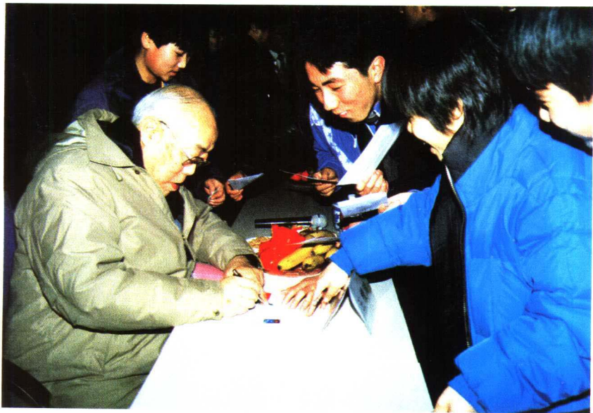
宏志班同学在“与老科学家共迎新世纪”活动中，著名科学家王绶琯为同学们签名