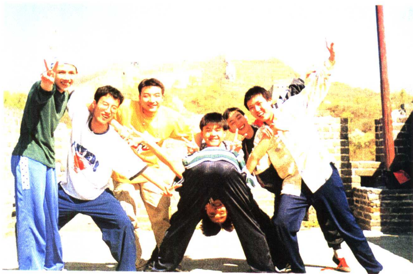
快乐的宏志班学生