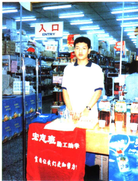
宏志班学生在打工现场