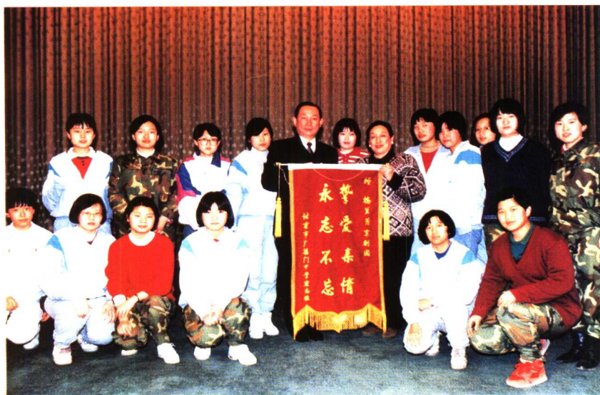
著名京剧表演艺术家梅葆玖、梅葆玥与宏志班同学们