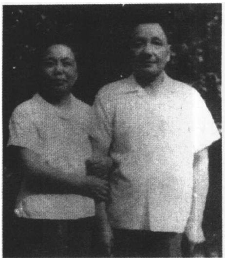
图1:“文革”期间在江西劳动的邓小平夫妇。

听到偌大的清江县当年工业产值仅有2600多万元,小平同志眉头微微一蹙,轻叹一声,意味深长地对陈祉川说,看来,你们县的潜力还大得很啰!