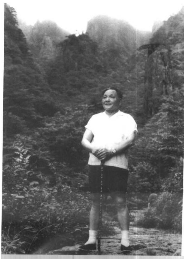
1979年7月11日至15日，75岁的邓小平登上了黄山之颠，显示出他顽强的意志和坦荡的襟怀。