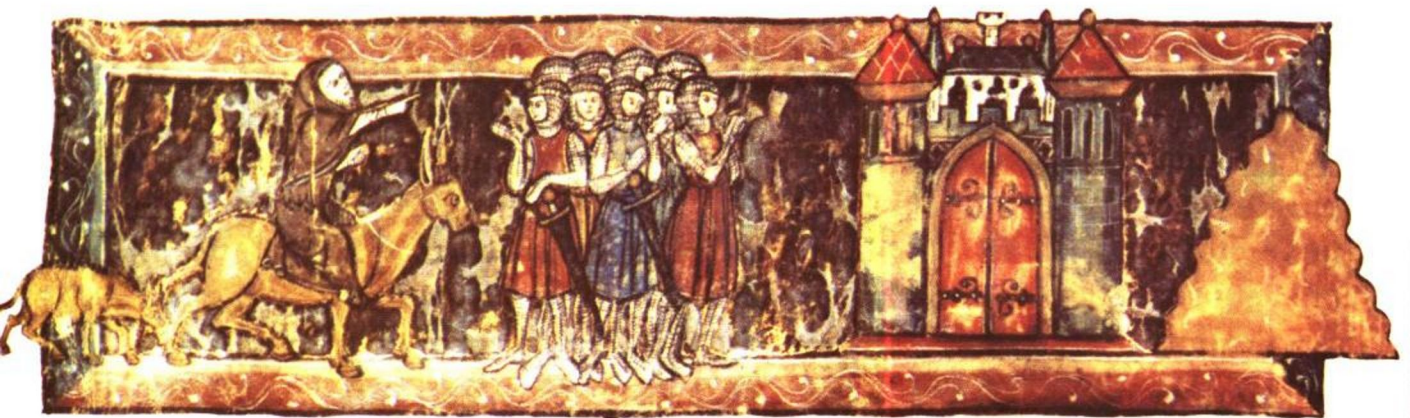
▲亞眠的修士皮爾，召集衆多的朝聖者參加第一次十字軍。皮爾於西元一〇九六年七月抵達君士坦丁堡，但參加十字軍東征的士兵們，因未按照皮爾的計劃行動，以致全被土耳其人所俘虜。

►這是西元一二〇〇年左右，阿拉伯文抄本的一張插圖，描繪出薩拉丁軍反擊十字軍的情形。西元一〇九六年至一二七〇年，西歐基督徒發動「十字軍戰爭」，意欲阻止回教勢力的擴大，並奪回回教徒佔領的土地。雖然這個計劃終未成功；然而，十字軍卻在拜占庭創立了一個「拉丁帝國」。