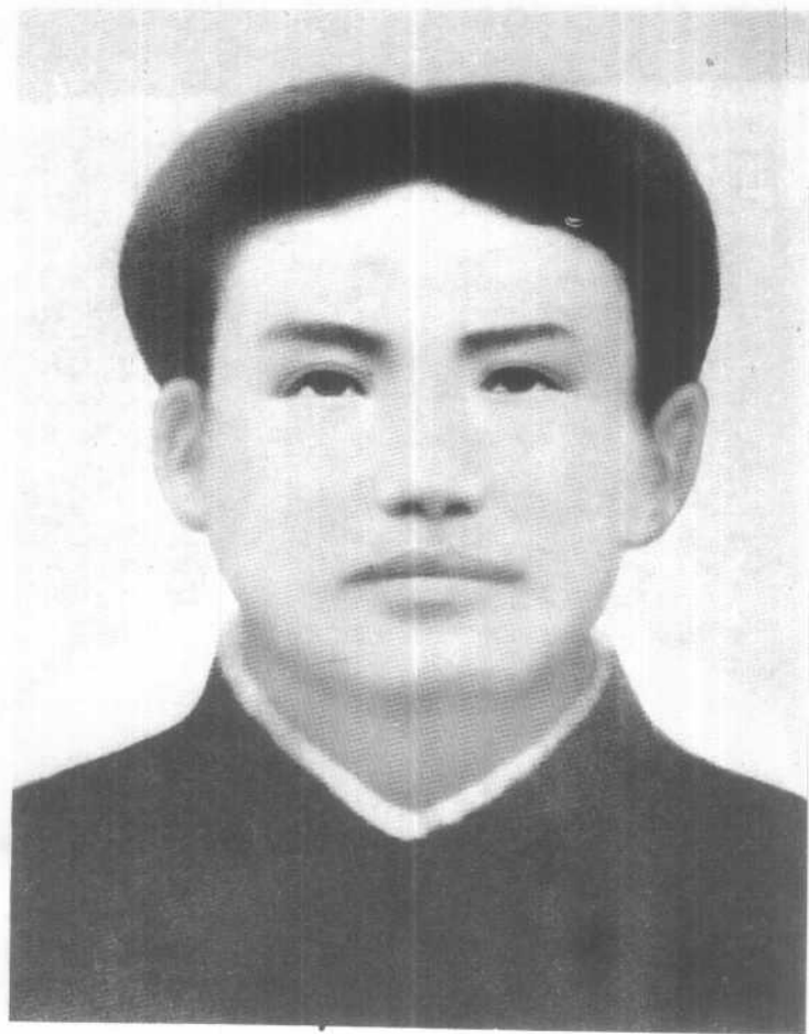
青年时代的毛泽东同志