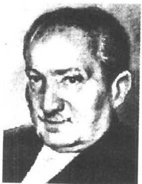
马丁·海德格尔 (Martin Heidegger, 1889 ~ 1976), 德国哲学家。