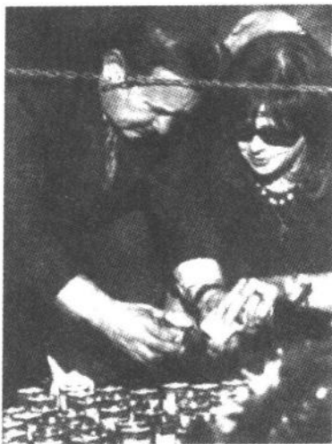
巴拉克将军点燃拉宾墓前的蜡烛

怀中掏出了一张写有《和平之歌》歌词的纸，与 20 万赶来参加和平集会的群众一起同声高唱了这首悠扬的、感人至深的和平颂歌。