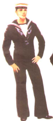
皇家海军 1966 加拿大