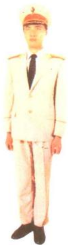
陆军 将官 夏礼服