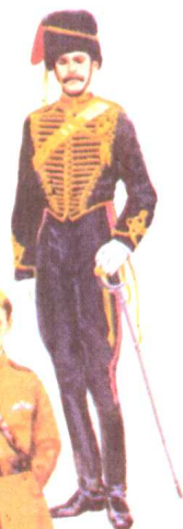
炮骑兵 1897 大不列颠