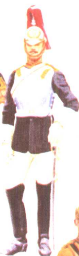
骑兵警卫军 1890 大不列颠