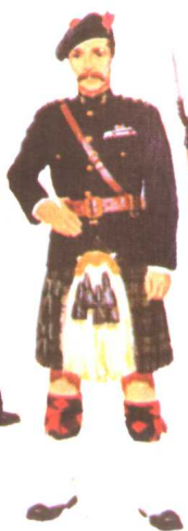
守夜警官 1946 苏格兰