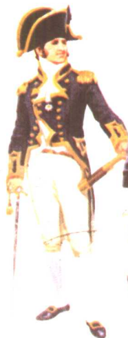
海军上校1812 大不列颠