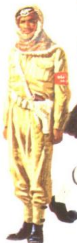
阿拉伯志愿军 1966约旦