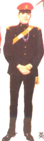
英国王室卫士 1966 大不列颠