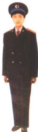
空军女尉官 冬礼服