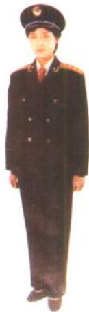
海军女校官 冬礼服