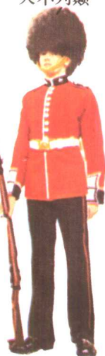
宫廷卫士 1966 大不列颠