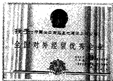
▲中基总公司上海公司荣获全国对外经贸优秀企业称号