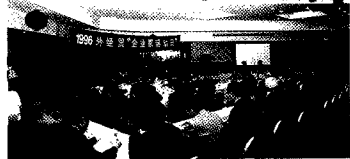
△外经贸企业家活动日会场