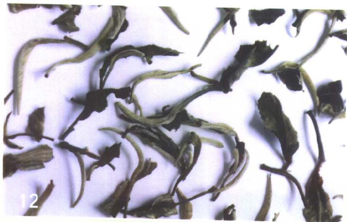
白 茶 (福建白牡丹)