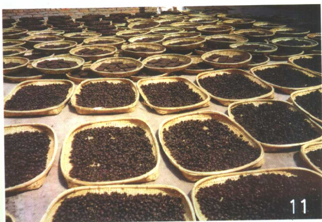
普 洱 茶 (云南沱茶)