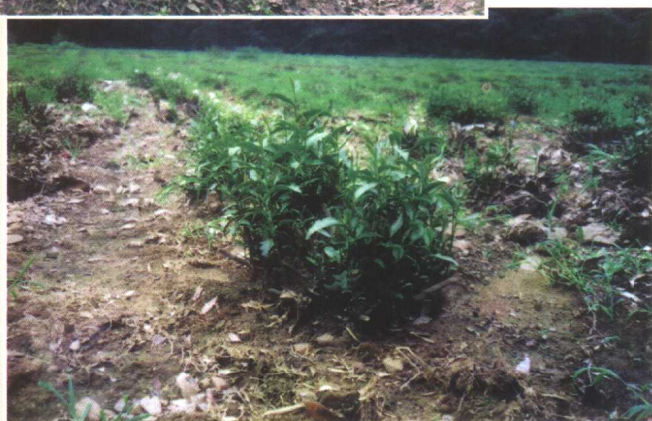
台刈后抽生的新枝