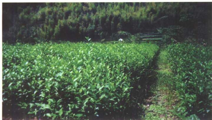
浙江乐清 雁荡山生 态茶园