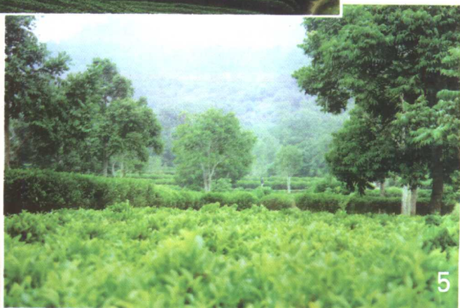
广东潮安 生态茶园