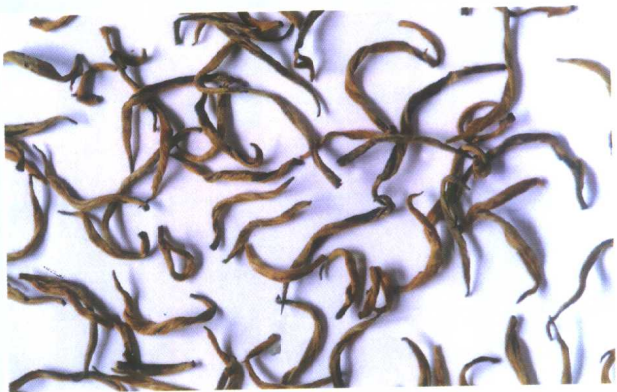
红 茶 (云南金毫)