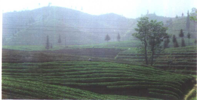
浙江开化 生态茶园