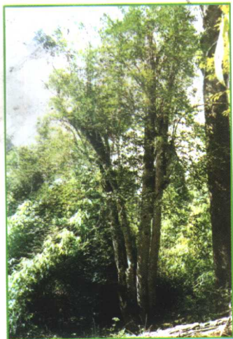
野生茶树 (树龄 1760 年 云南 巴达)