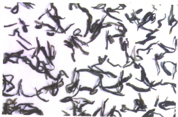
绿 茶 (毛 峰)