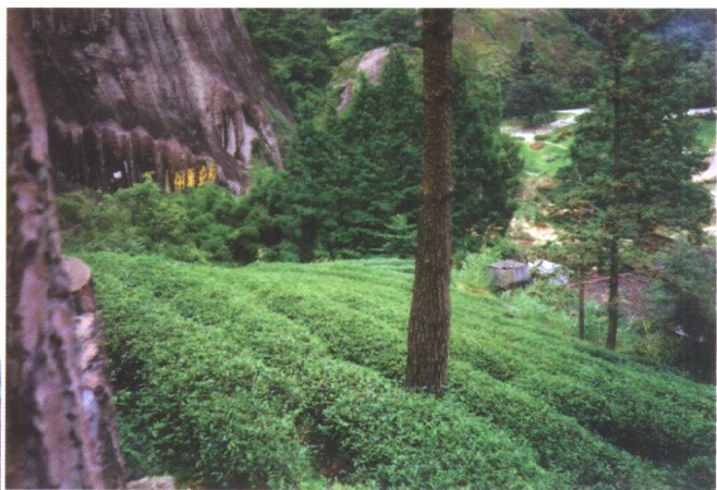
福建武夷山生态茶园