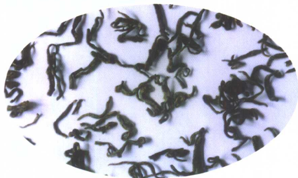
黄 茶 (四川蒙顶黄芽)