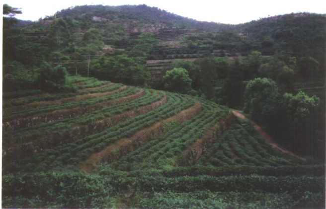
福建安溪 生态茶园