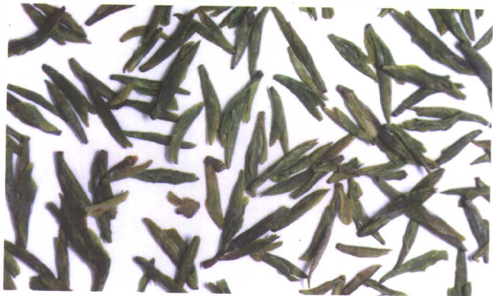
绿 茶 (西湖龙井茶)