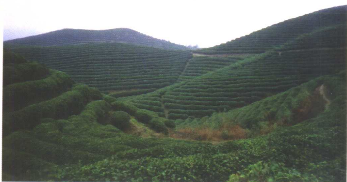
浙江武义 生态茶园