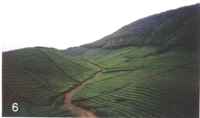
浙江余杭 生态茶园