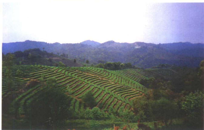
云南峨山 生态茶园