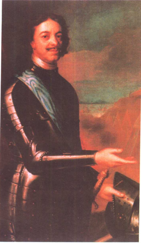
左上 俄国沙皇彼得大帝 右下 败于俄国的瑞典年轻国王查理十二 左下 日本江户幕府的创始人德川家康