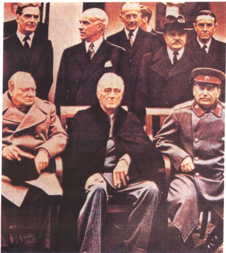
上图 1945年2月，苏、美、英三国首脑在雅尔塔会议上。右为斯大林，中为罗斯福，左为丘吉尔