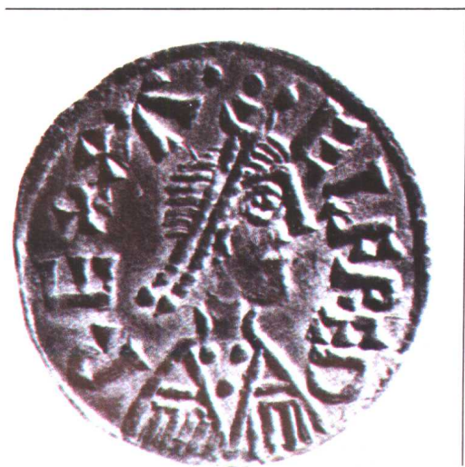
右下 跛子统帅帖木儿