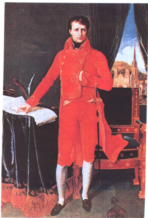
左上 海地革命领袖杜桑