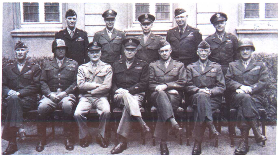
下图 1945年5月11日，美军高级将领合影。前排左二为巴顿，左四为盟军最高统帅艾森豪威尔，左五为布莱德利