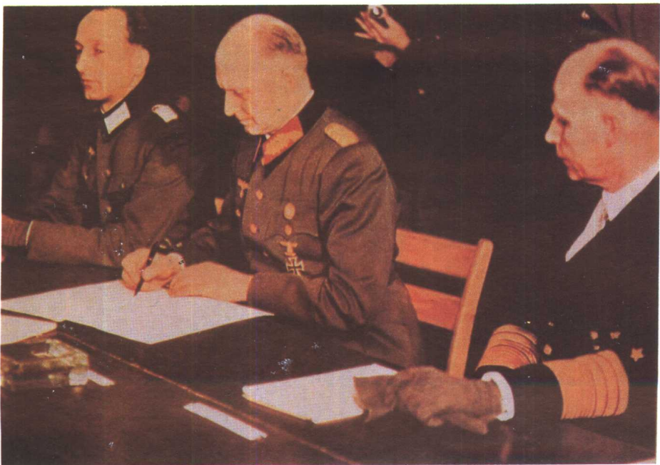
下图 1945年5月7日，约德尔代表德军在西线签署向西线盟军的投降书