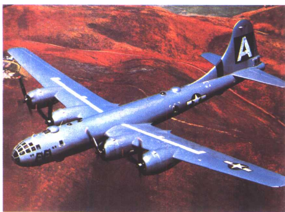
上 F-16 战斗机正在发射 AGM-65B 右 B-29 “超级飞行堡垒” 轰炸机 左 意大利 “长针” 战斗机