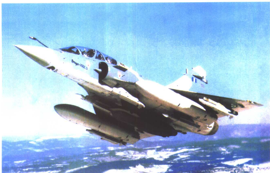
机身下挂载了“风暴阴影”火力圈外发射导弹的“幻影”2000-5MK2