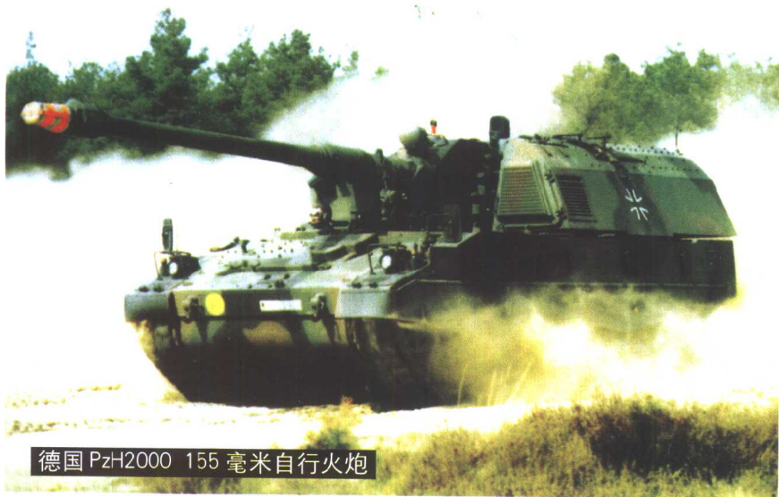
德国 PzH2000 155 毫米自行火炮