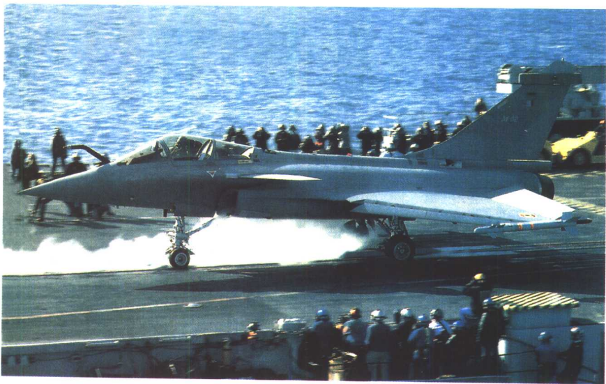
法国“阵风”M在“戴高乐”号航母上进行着舰测试