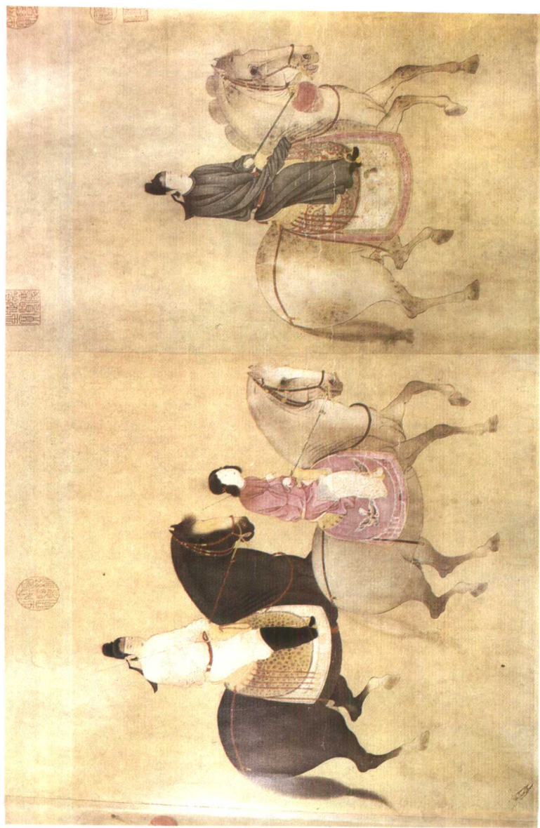
图4. 魏国夫人游春图(部分) 张萱 唐代