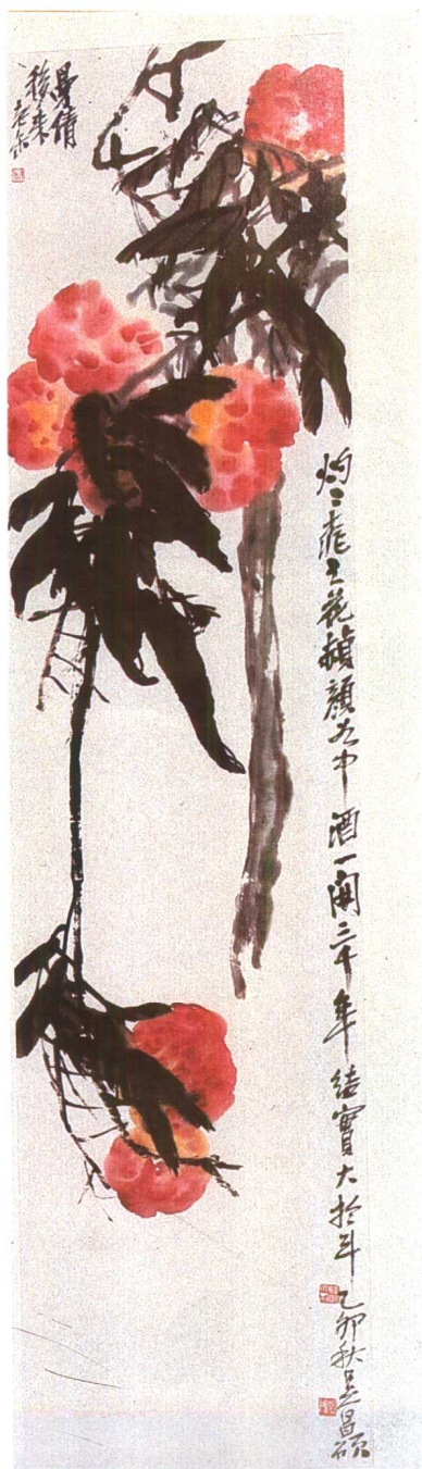
图9. 蟠桃 吴昌硕 近代