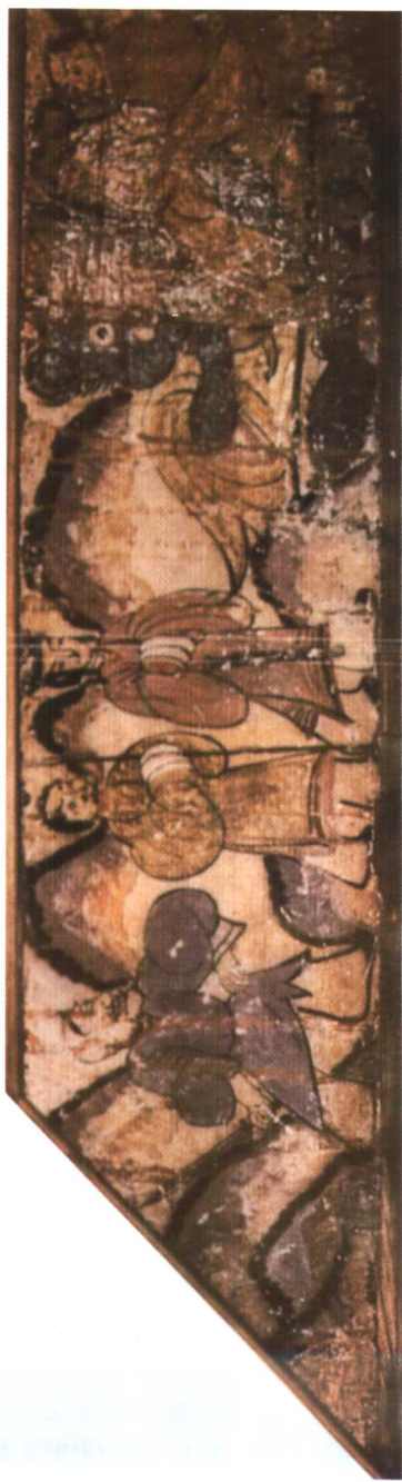
图2. 鸿门宴 洛阳烧沟61号汉墓