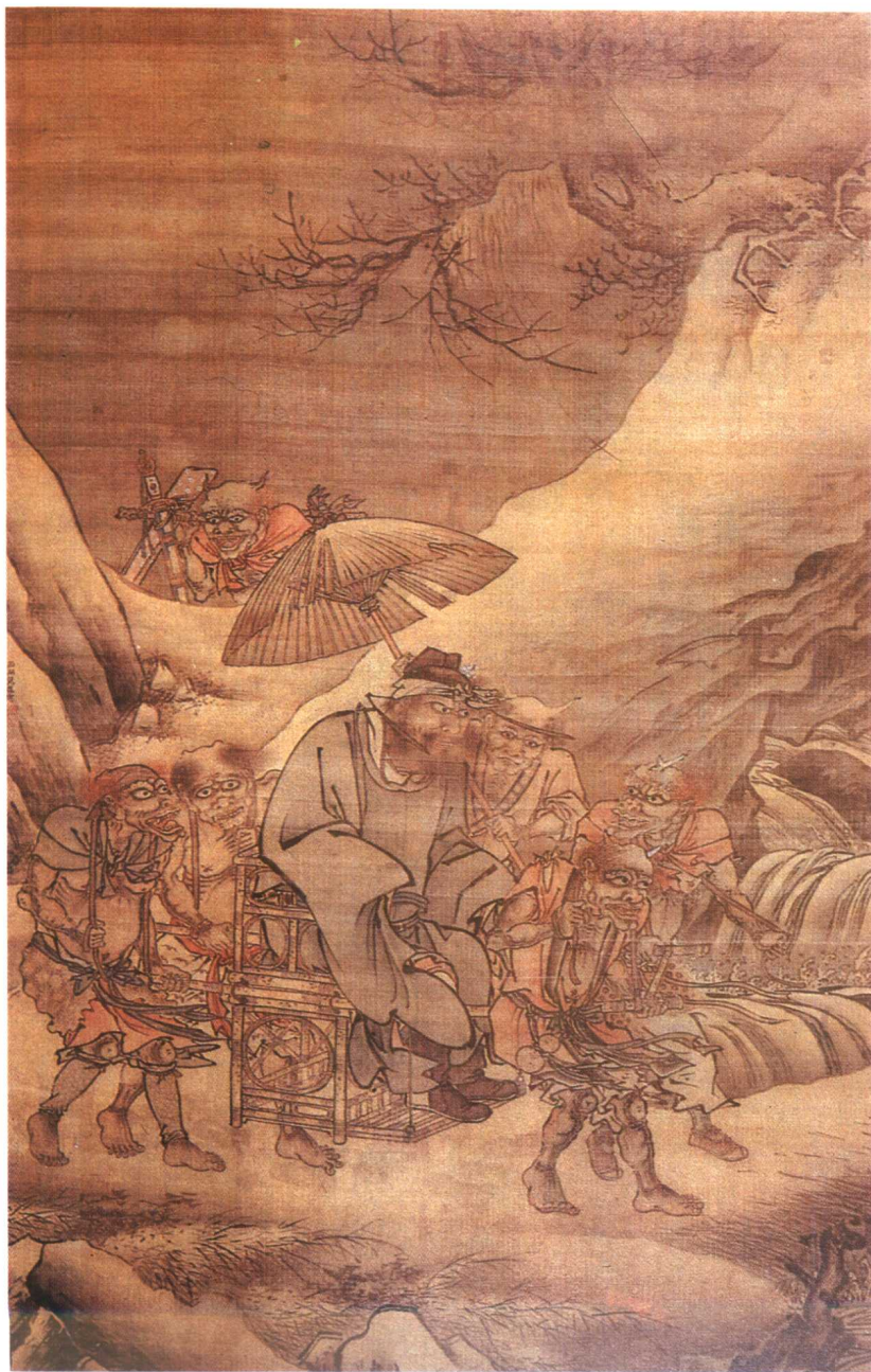
图7. 钟馗雪夜出巡图 戴进 明代