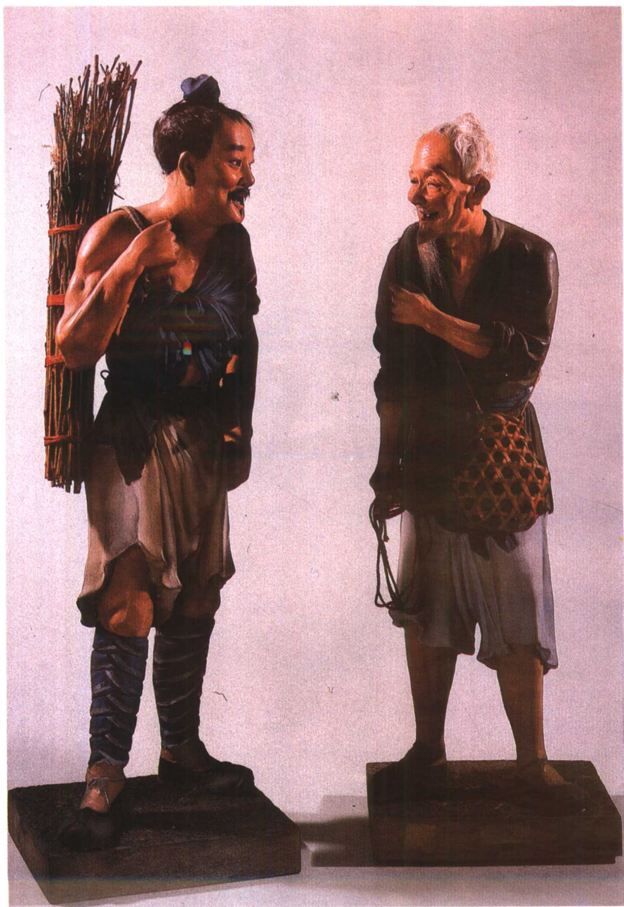
图 10. 渔樵对话 张明山 近代