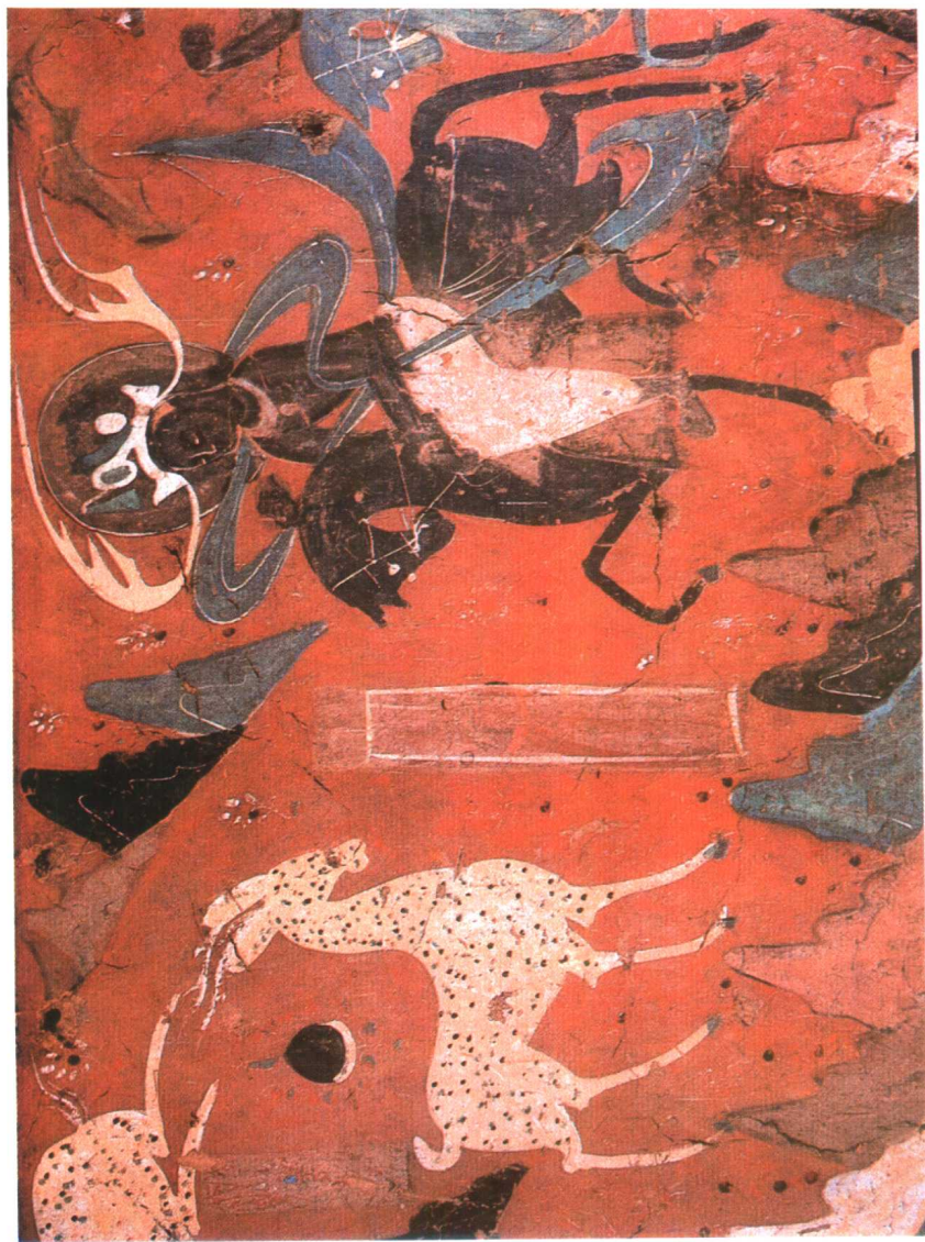
图 3. 敦煌莫高窟 257 窟鹿王本生(局部) 北魏