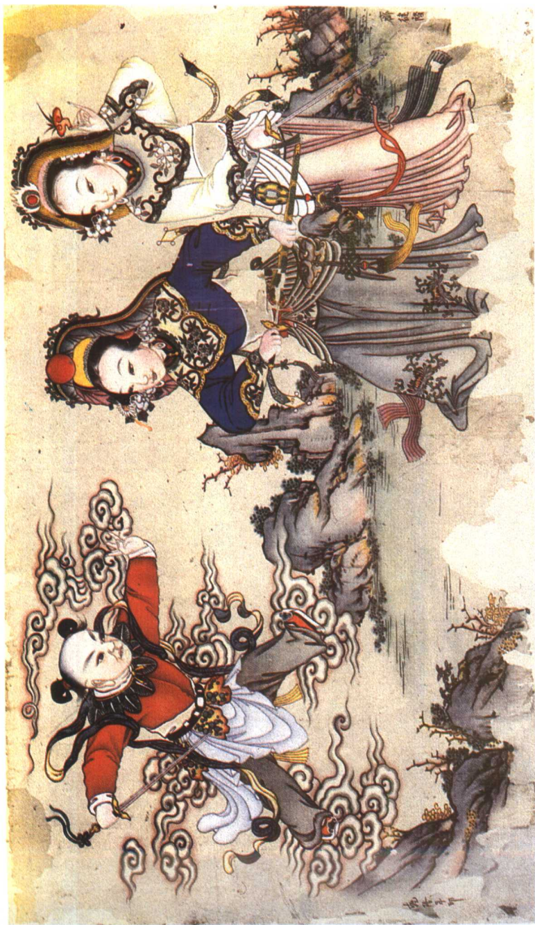
图 8. 盗仙草 杨柳青年画 清代