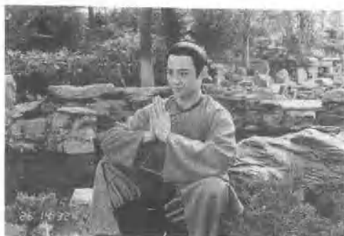
.....梅蘭芳故居·宋逸民.....