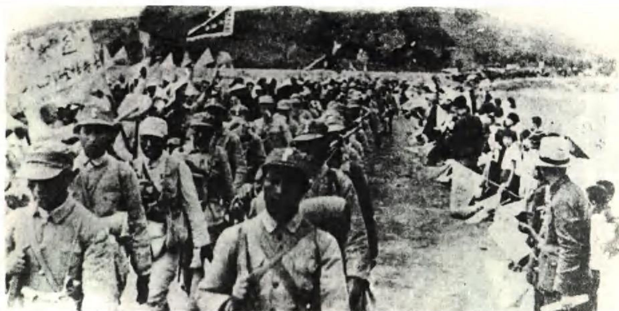
1946年5月30日在海城起义的国民党军第184师官兵撤离海城开赴解放区,沿途受到人民群众的热烈欢迎。