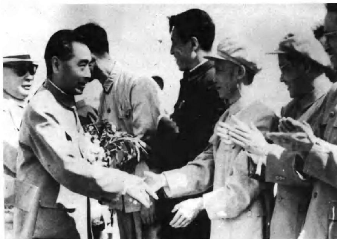
潘朔端转业地方工作后任昆明市市长。图为1964年周恩来总理、陈毅副总理出国访问归来在昆明机场同前来迎接的潘朔端市长握手。