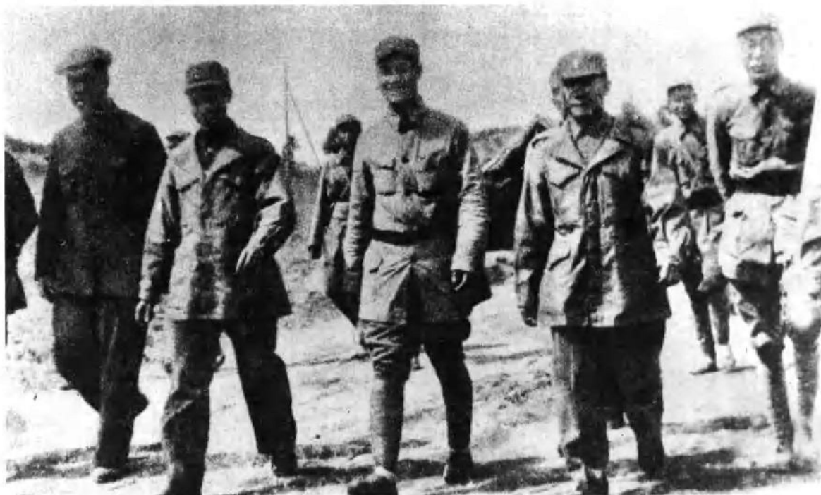
潘朔端率部起义后，受到东北民主联军的热切欢迎。图为潘朔端（前排中）在东北民主联军代表的陪同下，率部向解放区开进。