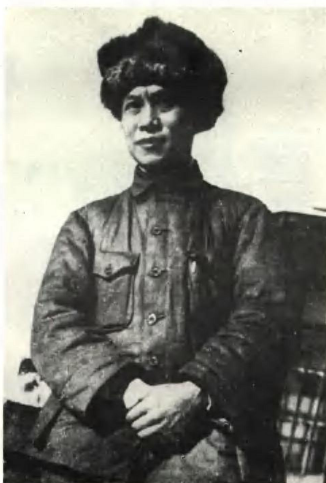
国民党军第184师师长潘朔端率部起义后换装留影。