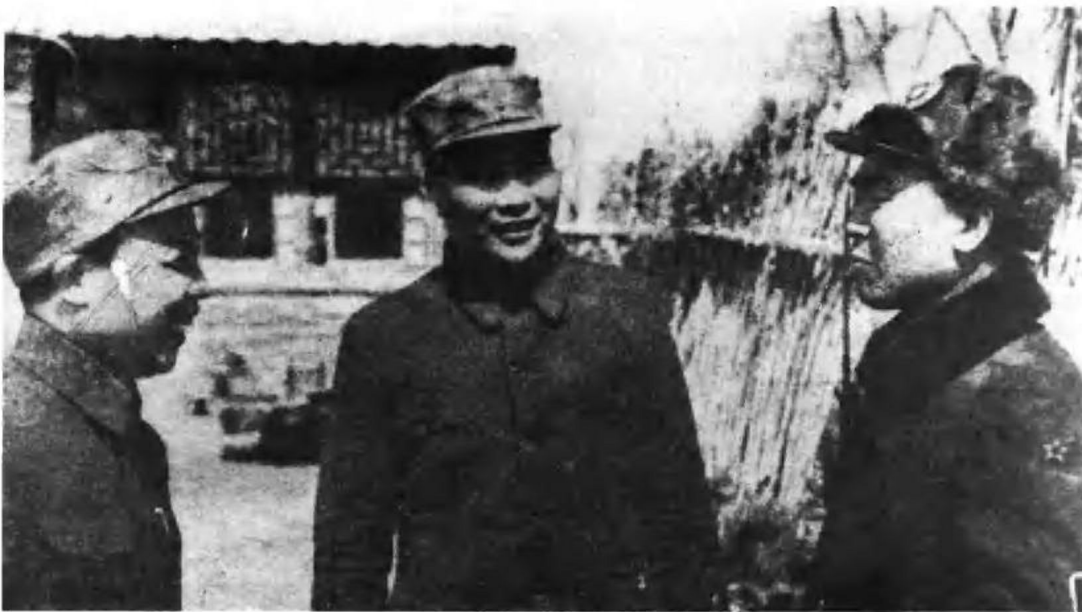
1948年10月17日国民党军第60军军长曾泽生(左3)率部在长春起义后，在长春市郊受到东北人民解放军第1兵团司令员肖劲光(左2)、政治委员肖华的亲切接见。