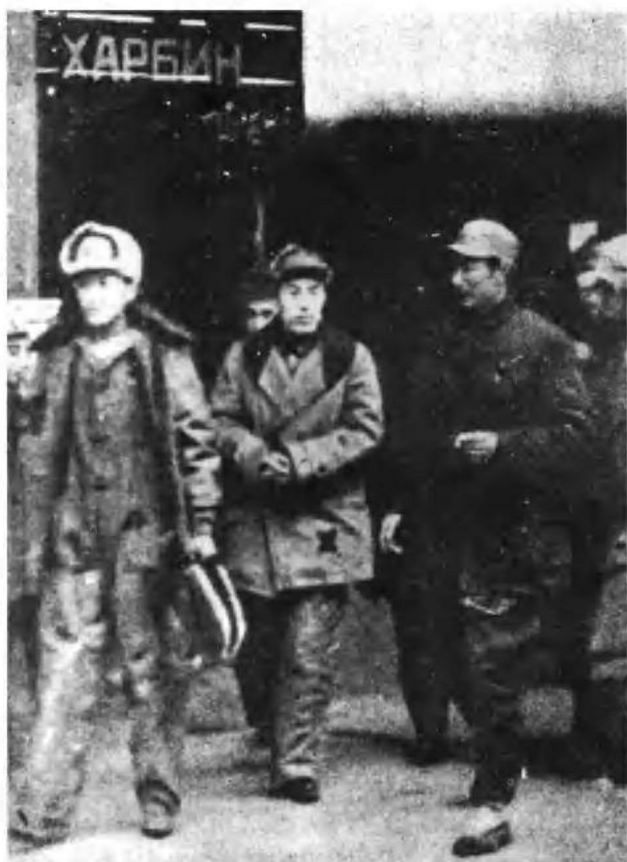
1948年10月21日,国民党军东北“剿总”副总司令兼第1兵团司令官郑洞国向人民解放军投诚。图为郑洞国(中)投诚后,于1948年10月25日乘火车到达哈尔滨车站时的情形。