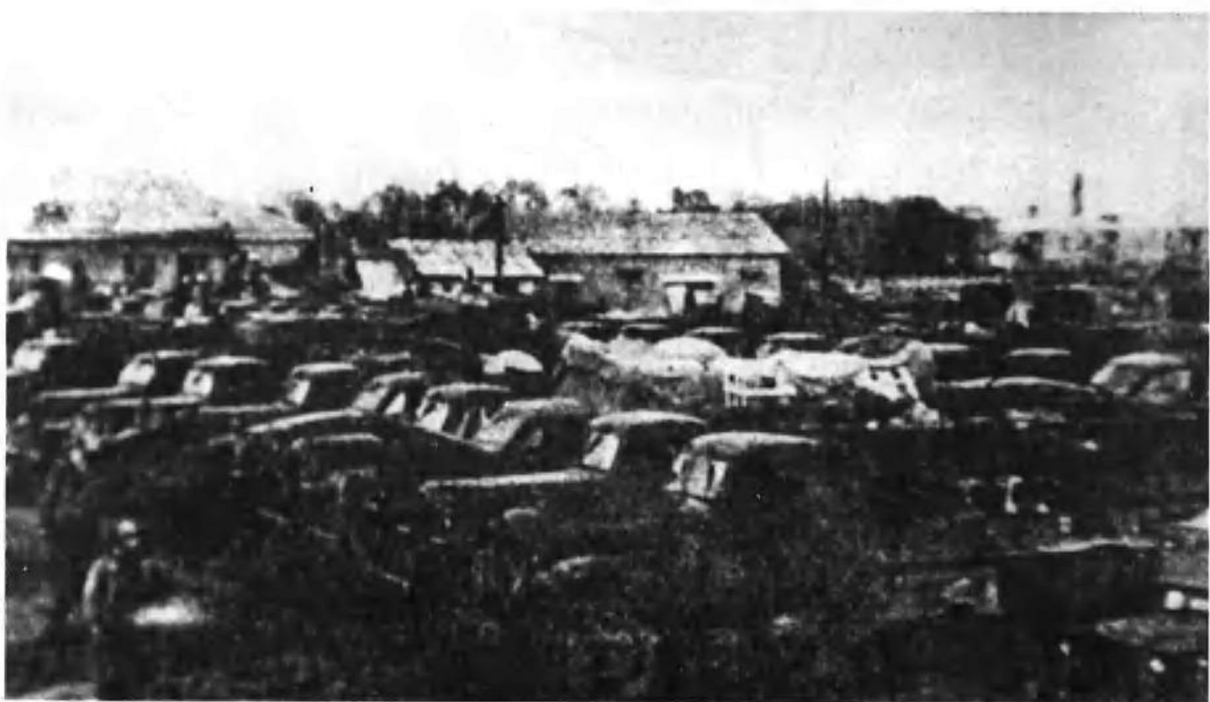
国民党军东北“剿总”直属汽车第17团在沈阳自动放下武器后，汽车被人民解放军接收时的情景。