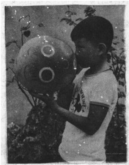
圖 1-1 氣球充氣何以膨脹

科學家借助檯球在檯桌上之運動爲模型，說明氣體在氣球內之行爲。運動中之檯球撞及桌邊而離開，且繼續滾動，撞到他方桌邊，再轉向，球越多，球與桌邊碰撞機會越多。今氣體之行性亦可以此相似方式解釋之。氣球內之氣體，視爲小質點之集合體，不停碰撞球壁，而呈現壓力；氣體質點增加時，質點與球壁碰撞次數亦增加，故氣球膨脹。氣球粒子不停運動，氣球壁有彈性，此外檯球與氣體粒子具有相似之特性，故用檯球爲模頗合適。第三章吾人將更詳細論及氣體之模型。