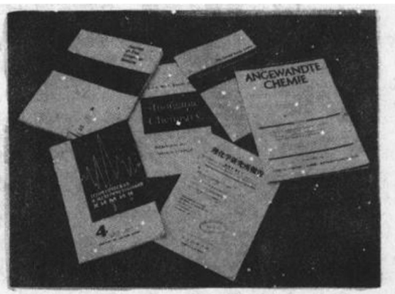
圖 1-2 不同文字之科學雜誌