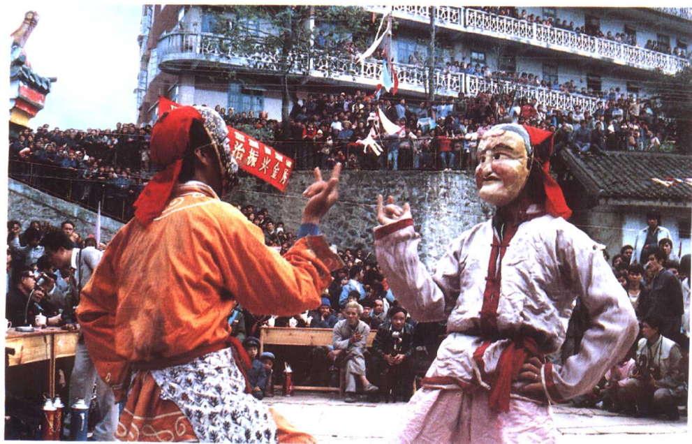
瑶族面具舞