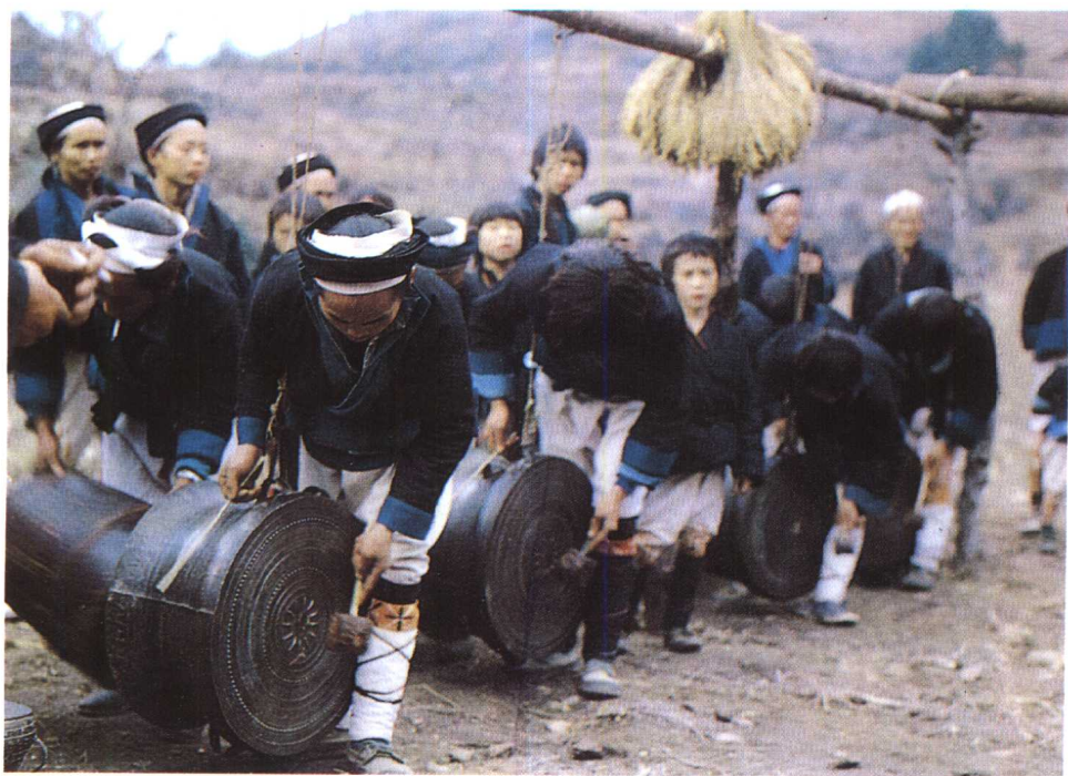
瑶族击鼓祭祖