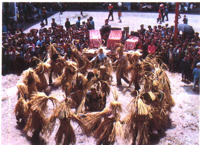
土家族毛古斯舞