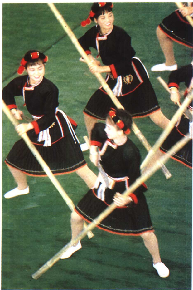
壮族打扁担