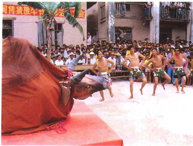
壮族敬牛节盛况