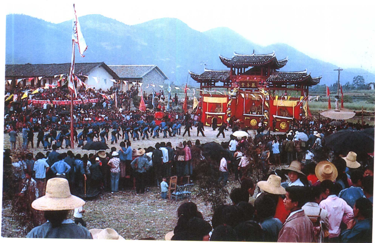
土家族春节摆手舞会