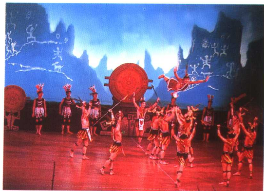
壮族舞蹈花山战鼓 林国志摄