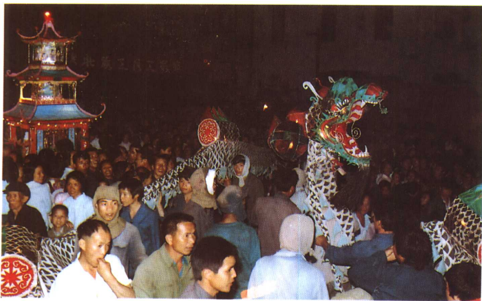
壮族三月三歌节