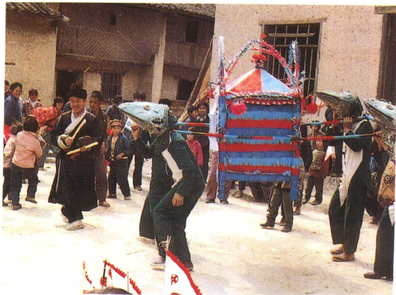
壮族欢度蚂蚱节