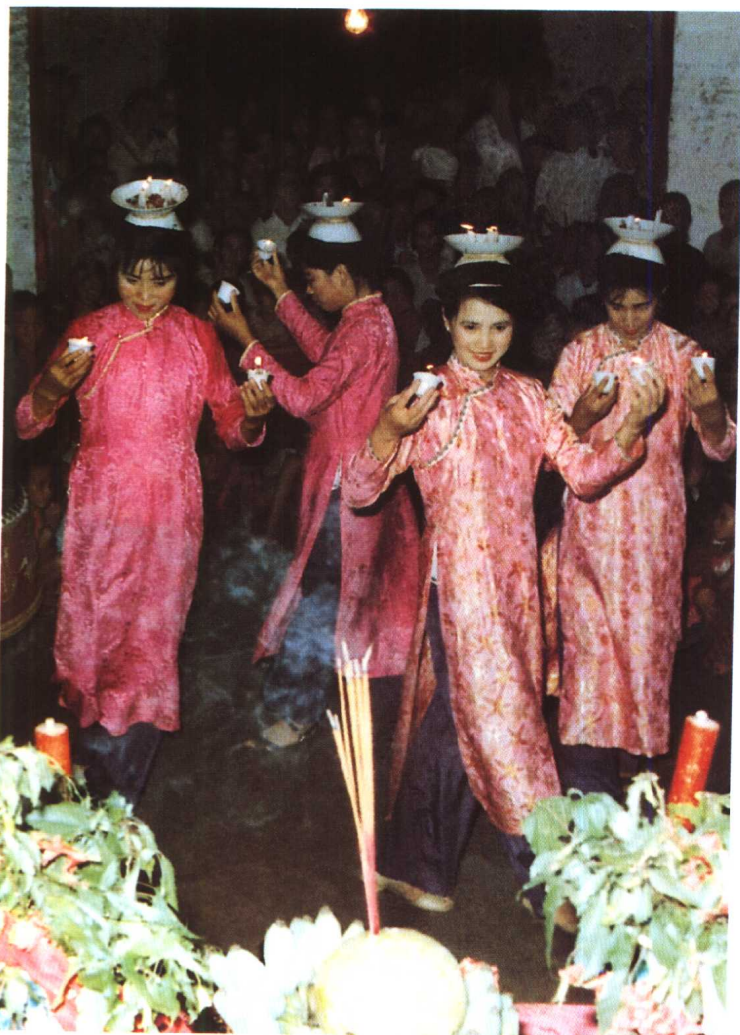
京族花灯舞 霍永添摄