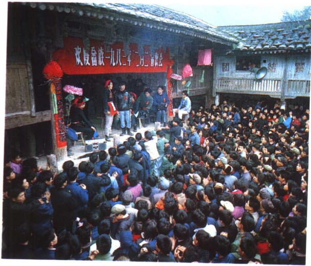
畚族二月二歌会