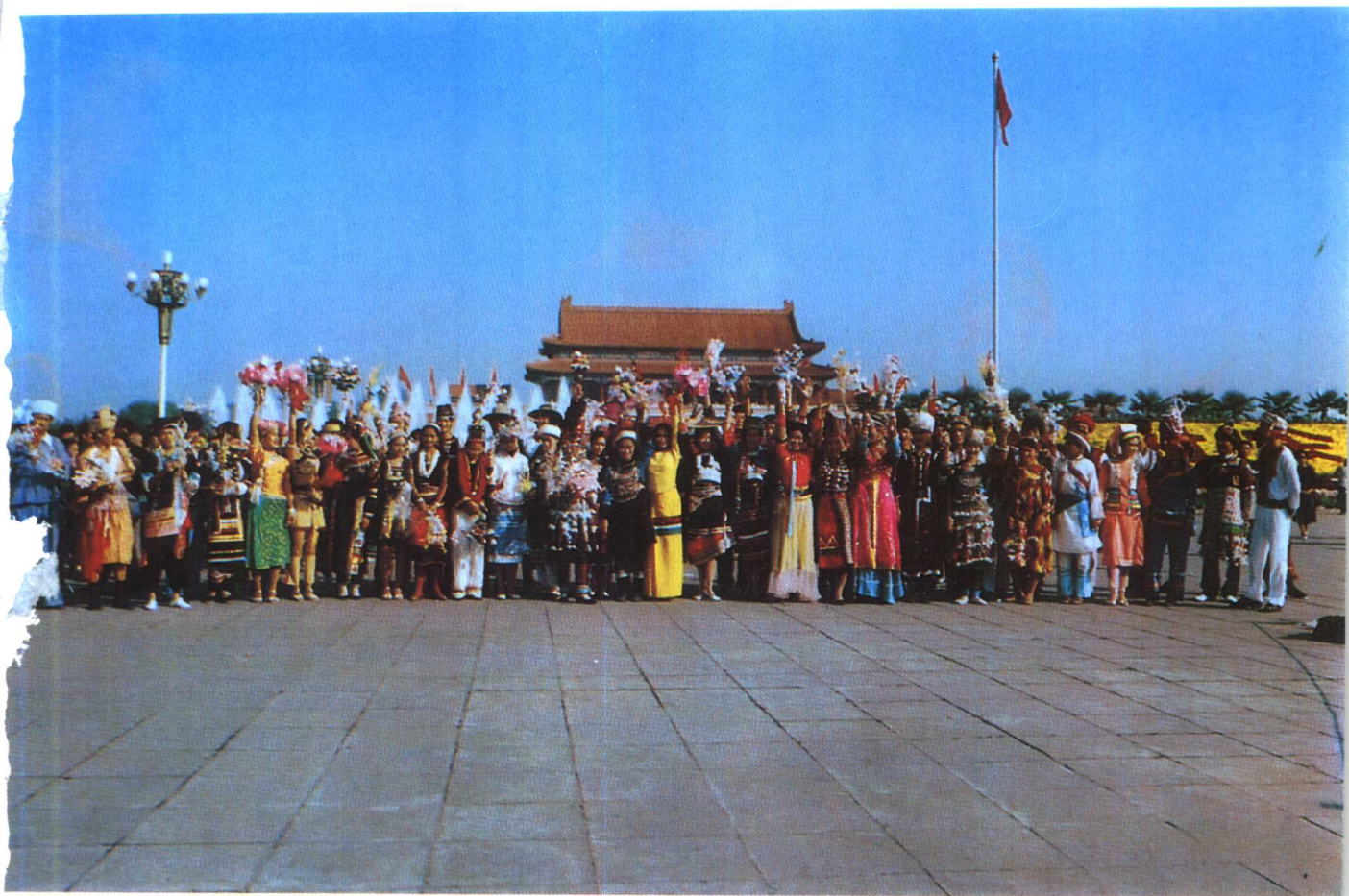
生活在祖国大家庭中的 55 个少数民族