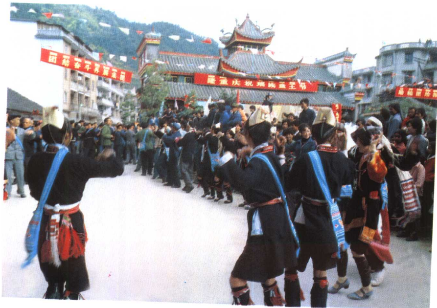
瑶族同胞欢度 盘王节盛况