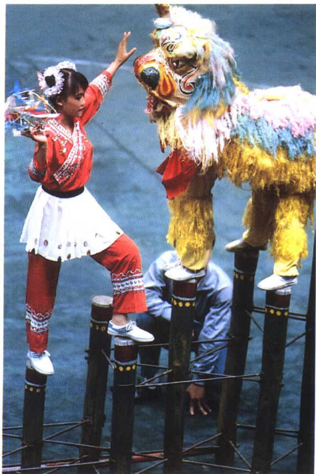
壮族黄狮梅庄