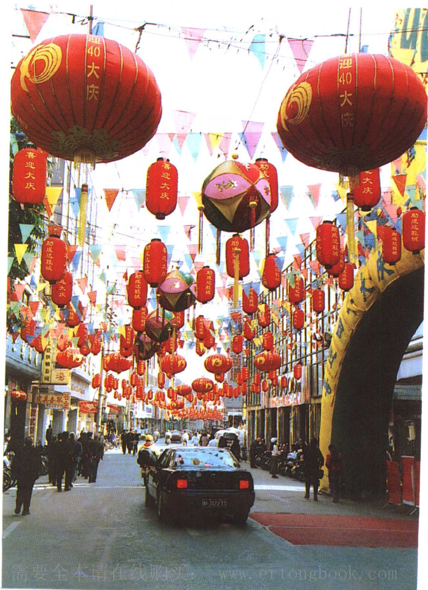
广西壮族自治区成立40周年大庆的南宁市街头