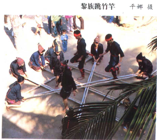
黎族跳竹竿 平娜摄