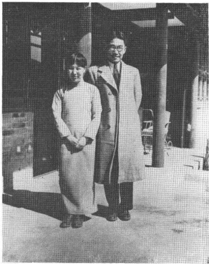
冰心和吴文藻先生在北平(1935年摄)