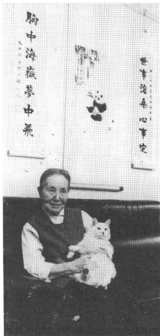
冰心在自家客厅里(1986年摄)