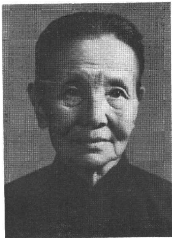
冰 心 近 影