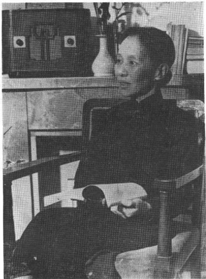
冰心在日本(1947年摄于东京)