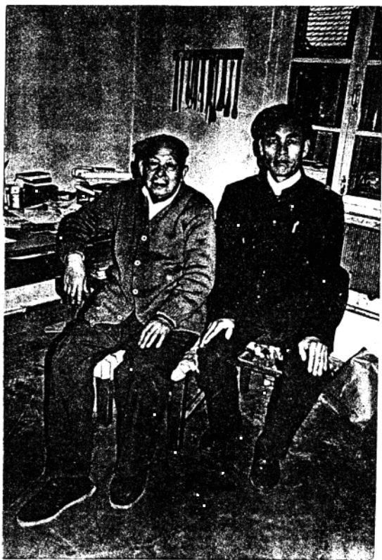
曲良义同原中医药管理局吕炳奎局长合影於北京