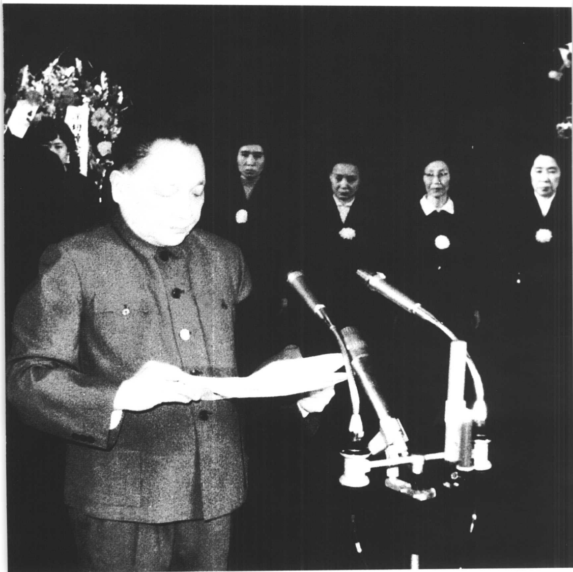
↑ 1980年5月，邓小平在北京刘少奇同志追悼大会上致悼词。后排右起：王光美、李妙秀、刘爱琴、刘平平。