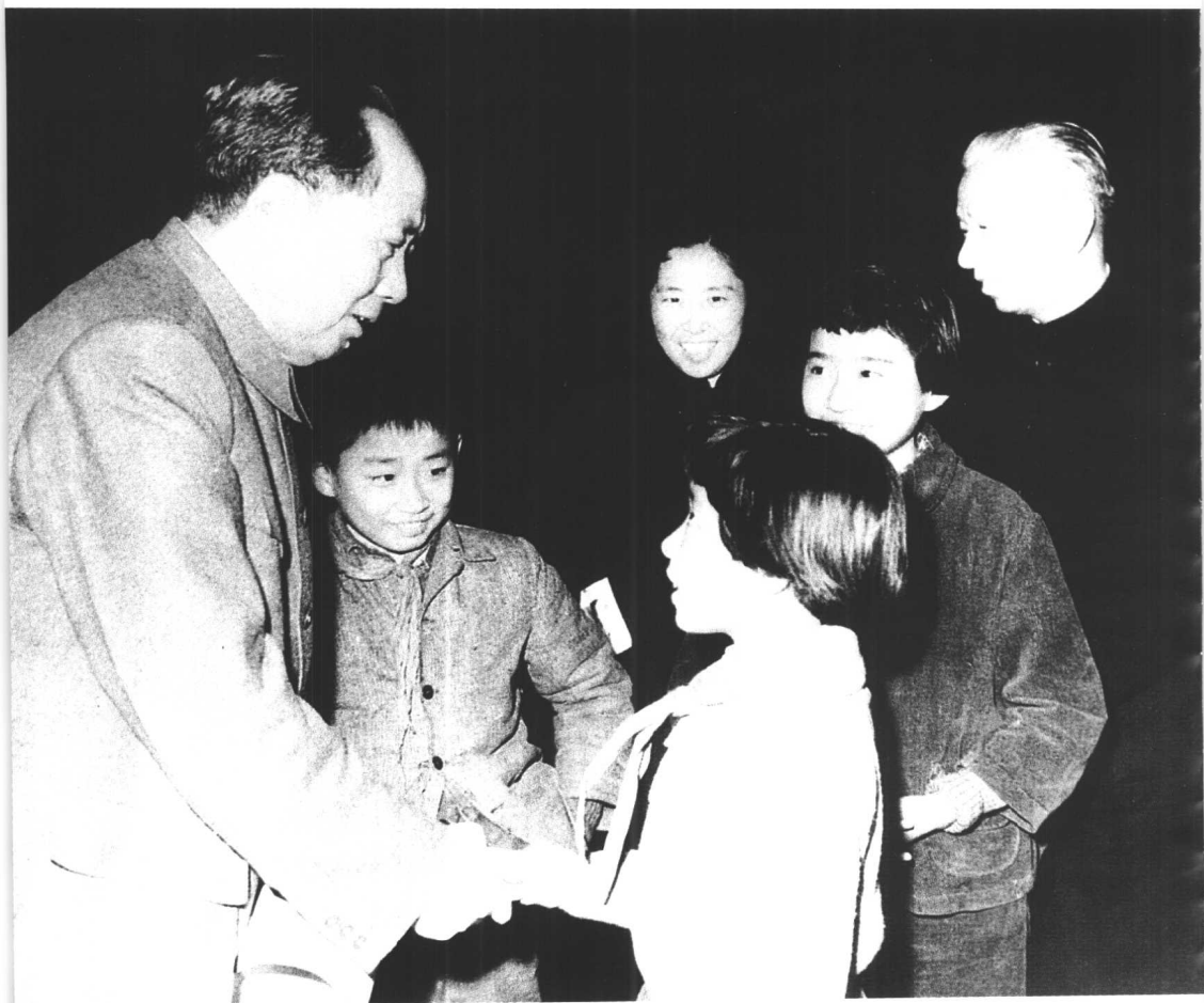
↑ 1962年，毛泽东看望刘少奇一家。左起：毛泽东、刘源、王光美、刘亭亭、刘平平、刘少奇。