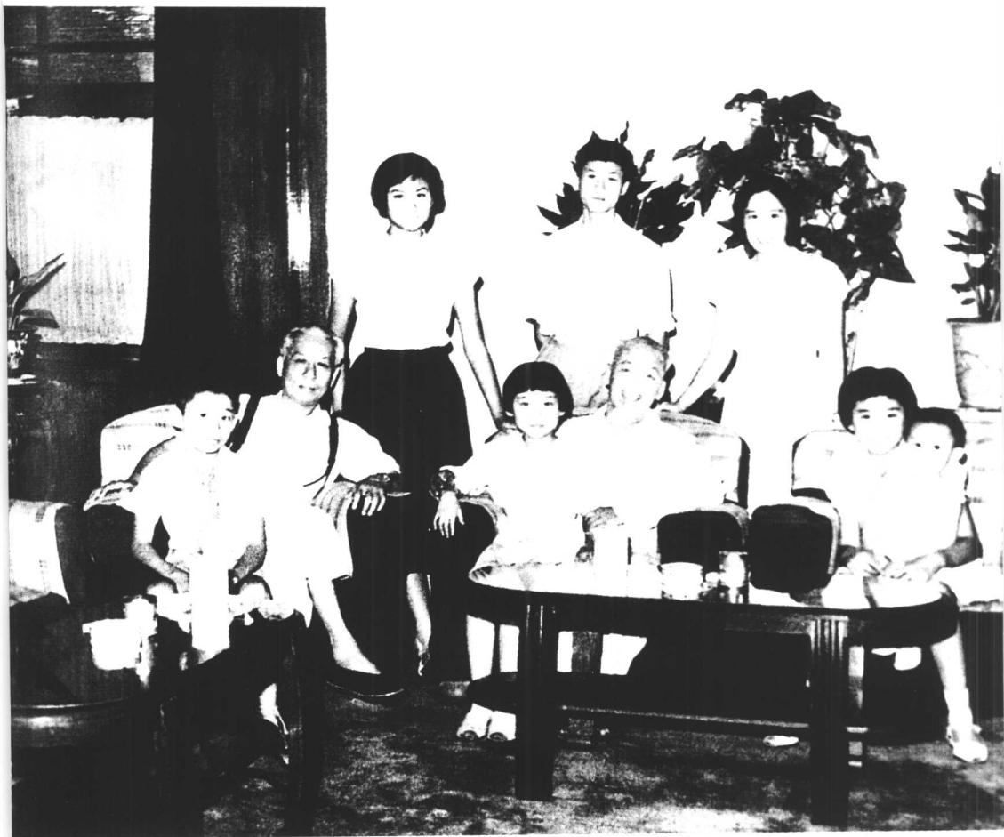
↑ 1962年，胡志明到刘少奇家中作客。前排左起：刘源、刘少奇、刘亭亭、胡志明、刘平平、刘小小；后排右起：王光美、刘允真、刘涛。