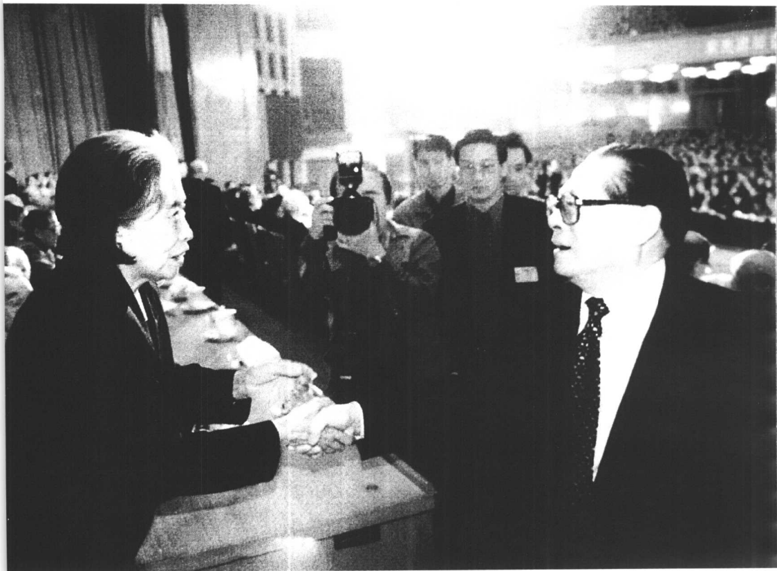
↑ 1998年11月20日，在北京人民大会堂纪念刘少奇诞辰100周年大会上，江泽民与王光美亲切握手。