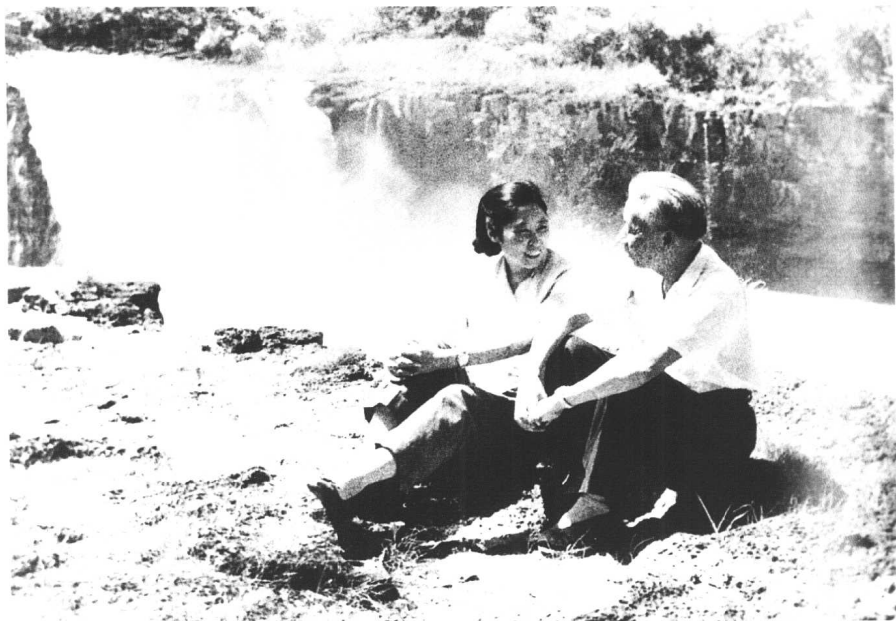
↑ 1961年7月，刘少奇同王光美在镜泊湖。