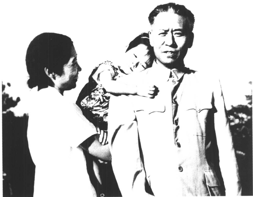
↑ 1956年，刘少奇、王光美同女儿亭亭在一起。