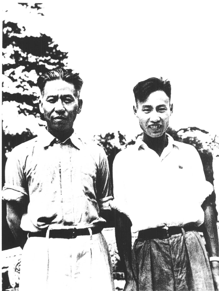
↑ 1950年7月，刘少奇同儿子刘允若在北京。