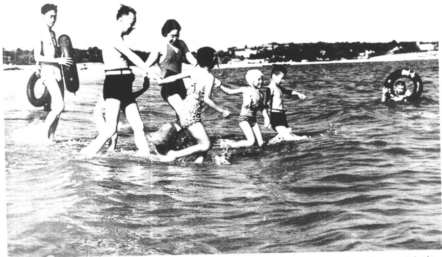
↑ 1954年夏，刘少奇、王光美同子女在北戴河游泳。左二起：刘少奇、王光美、刘涛、杨尚昆的女儿杨李、刘允真（丁丁）。