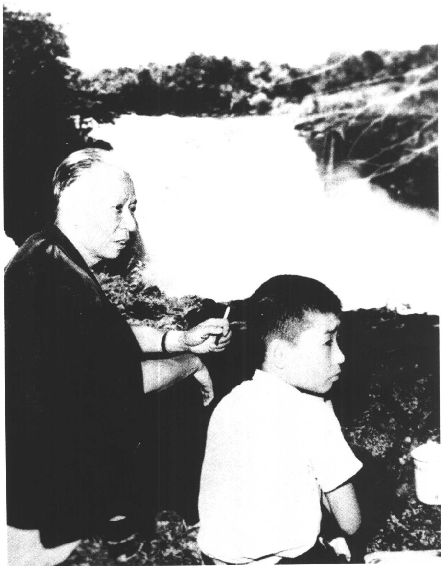
↑ 1961年夏，刘少奇和儿子刘源在牡丹江林区。