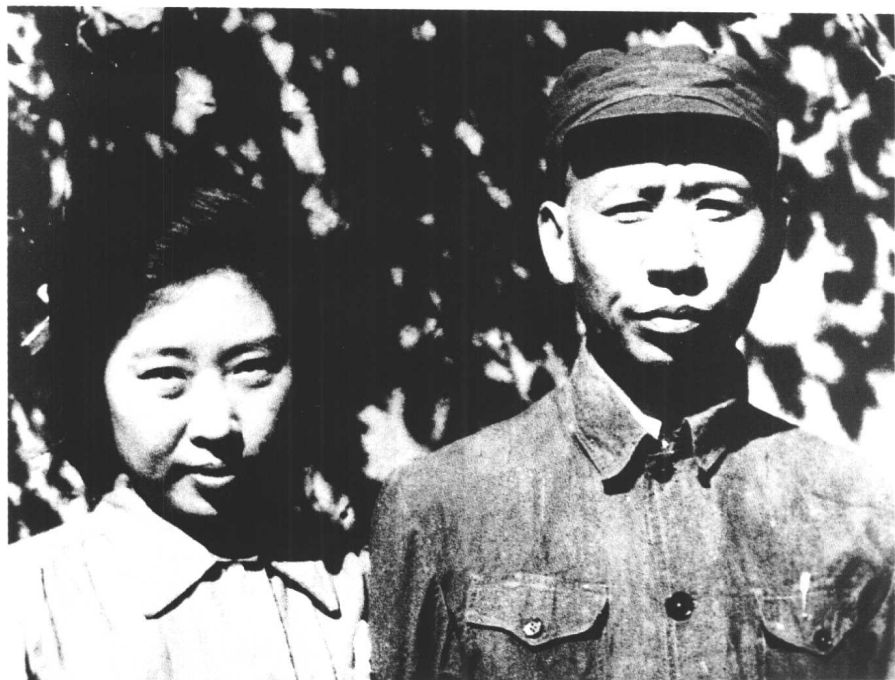
↑ 1948年8月21日，刘少奇同王光美在西柏坡结婚时合影。