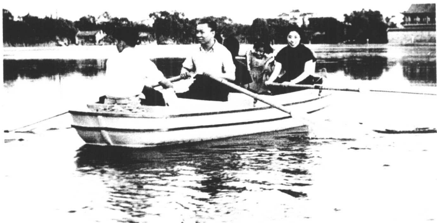
↑ 1953年夏，刘少奇、王光美在中南海的南海划船。右二为刘涛。