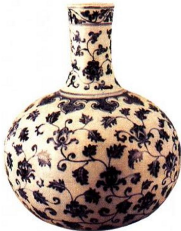
永乐 青花缠枝花卉天球瓶