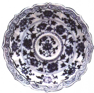
洪武 青花缠枝花纹葵口盖托