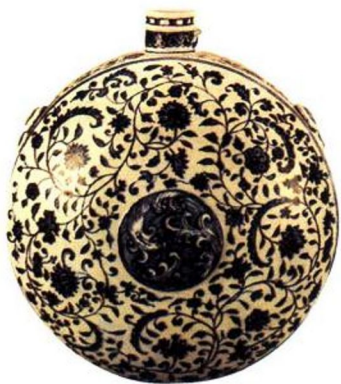
永乐 青花缠枝莲纹大扁壶