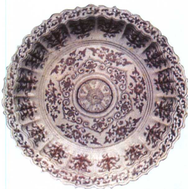
洪武 景德镇窑釉里红花卉纹菱口盘