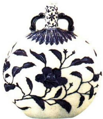
永乐 青花花纹扁壶