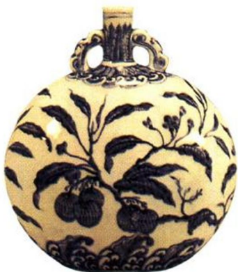
永乐 青花荔枝纹扁壶