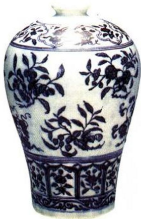
永乐 青花折枝花果纹梅瓶