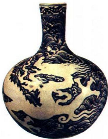
永乐 青花海水龙纹天球瓶