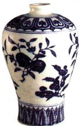
永乐 青花折枝花果梅瓶