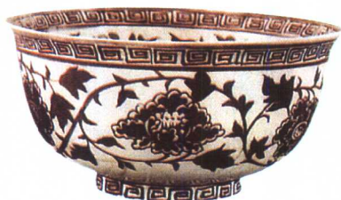
洪武 景德镇窑釉里红缠枝花卉纹碗