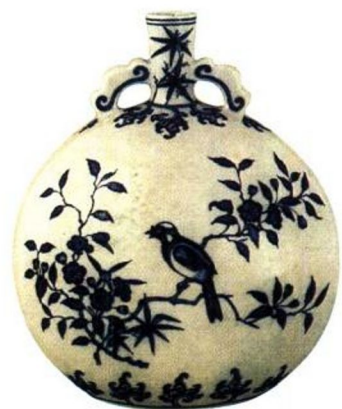
永乐 青花花鸟扁壶