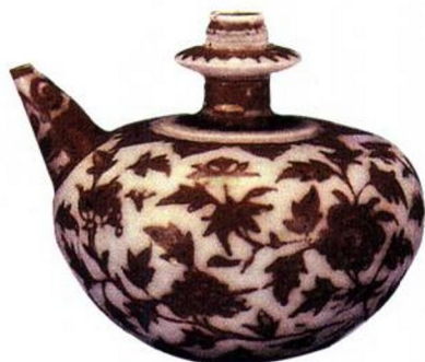
洪武 景德镇窑釉里红牡丹纹军持