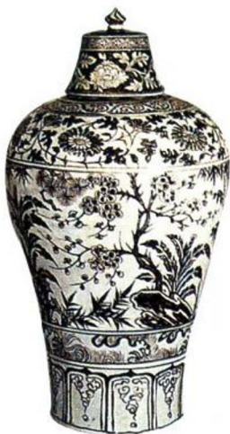
洪武 景德镇窑釉里红松竹梅芭蕉图盘