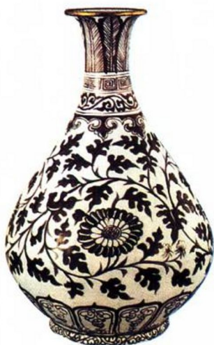
洪武 釉里红菊花玉壶瓶