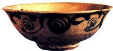
洪武 青花结带绣球纹碗