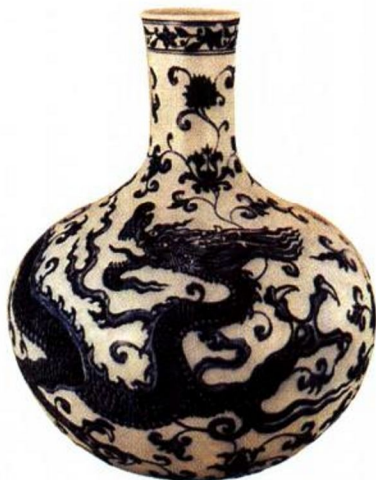
永乐 青花龙纹天球瓶