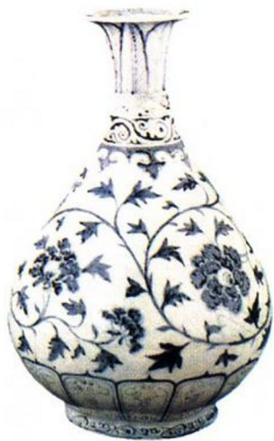
洪武 青花牡丹玉壶瓶