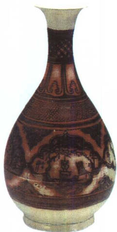
洪武 景德镇窑釉里红开光人物故事图瓶