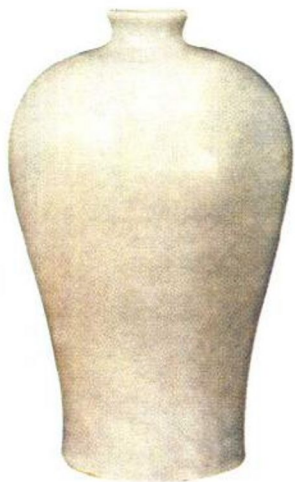
永乐 甜白暗刻莲花梅瓶