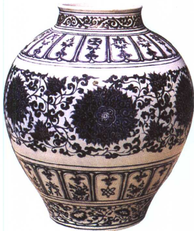
洪武 青花缠枝莲大罐