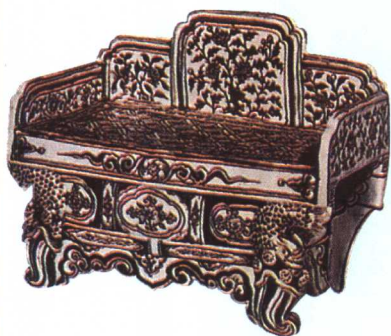
洪武 景德镇窑釉里红卉纹神座