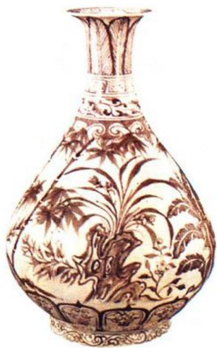
洪武 釉里红三友玉壶春瓶