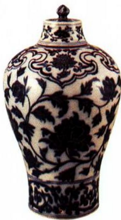
永乐 青花缠枝牡丹带盖梅瓶