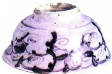
洪武 青花云气纹碗 (洪武一永乐)