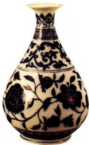
永乐 青花花卉玉壶春瓶