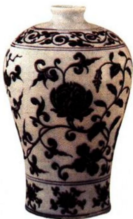
永乐 青花缠枝莲纹梅瓶