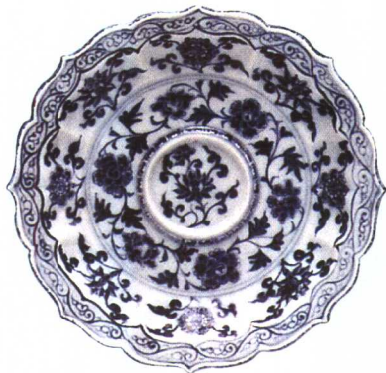
洪武 青花牡丹纹花口大盘