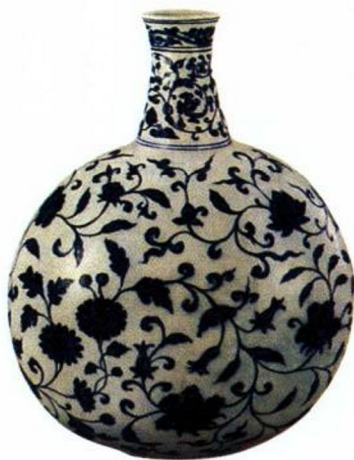
永乐 青花缠枝莲纹大扁壶