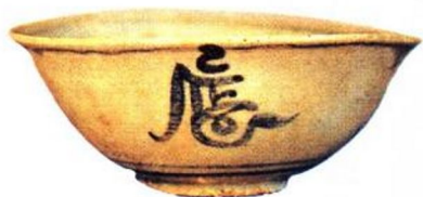
洪武 青花凡字纹碗