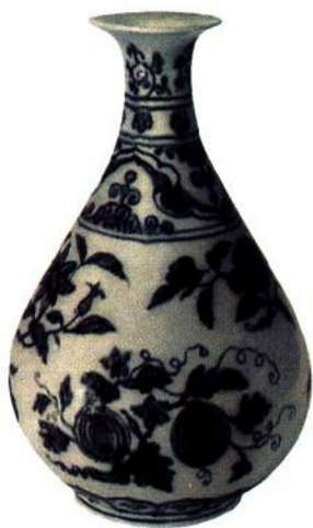
永乐 青花折枝三果玉壶春瓶