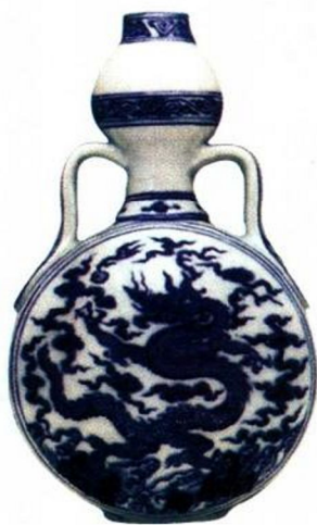
永乐 青花双耳龙纹葫芦扁瓶