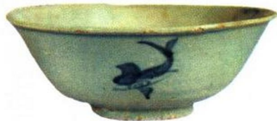
洪武 青花游鱼纹碗