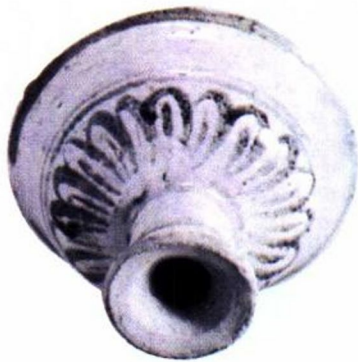
洪武 青花莲瓣纹高足把杯 (洪武—永乐)