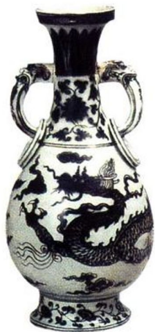
洪武 景德镇釉里红云龙纹环耳瓶