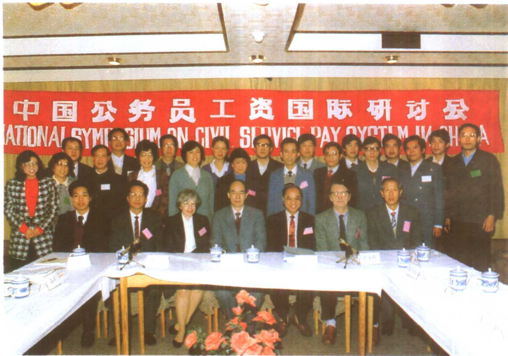
1989年秋季，中国公务员工资国际研讨会在京召开。