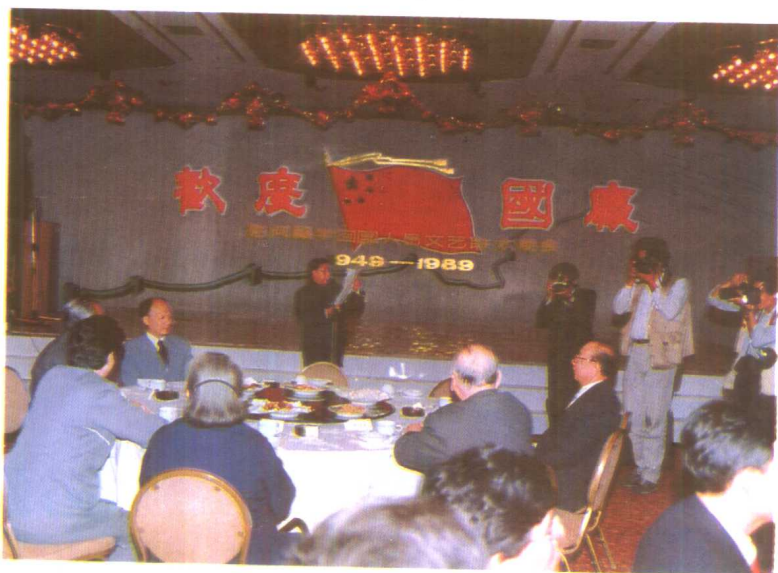
1989年10月2日，人事部在北京国际饭店举办了慰问留学回国人员文艺联欢晚会。