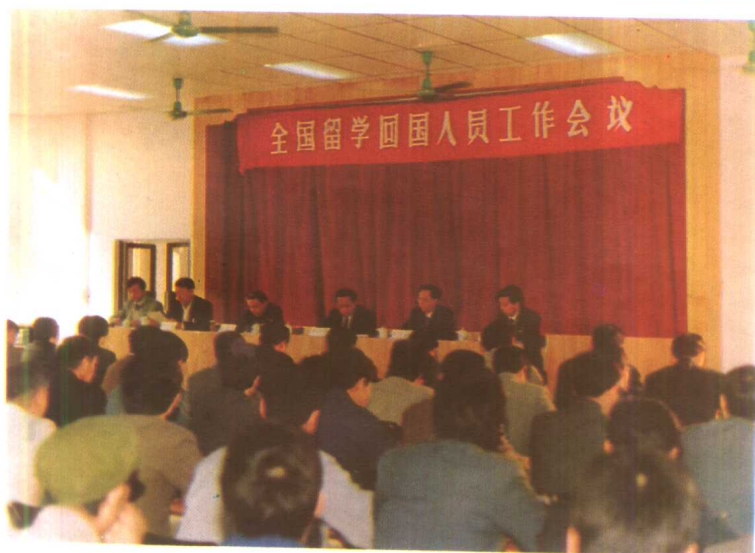
1989年12月1日，人事部在深圳召开全国留学回国人员工作会议。