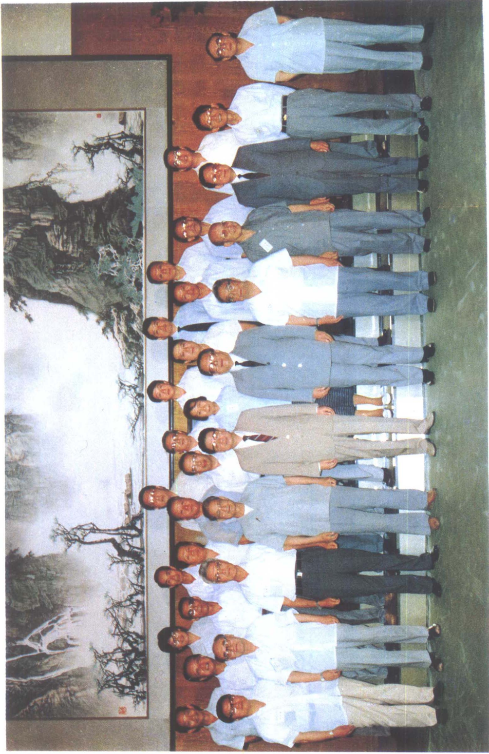
念留瀑合司炎型案寺埔貢出突許位階已志同昇殿央中誓平宋，翻李，另華正，日88月8年8881