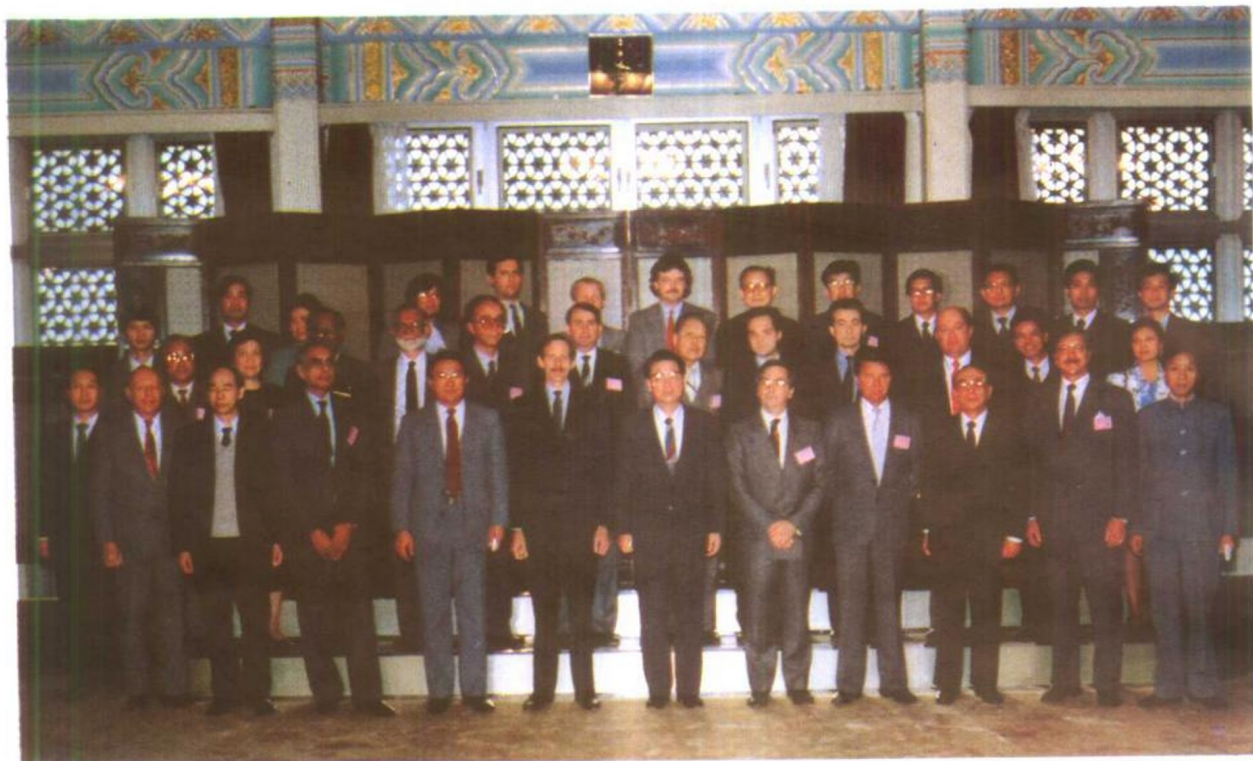
上：1989年10月17日，国务院总理、国家机构编制委员会主任李鹏接见参加政府行政管理改革国际研讨会的全体外宾 左：李鹏总理为《中国机构与编制》杂志创刊一周年的题辞。 下：中国人才研究会第二届理事会第三次会议于1989年12月20日在京召开，赵东宛同志当选为理事长。