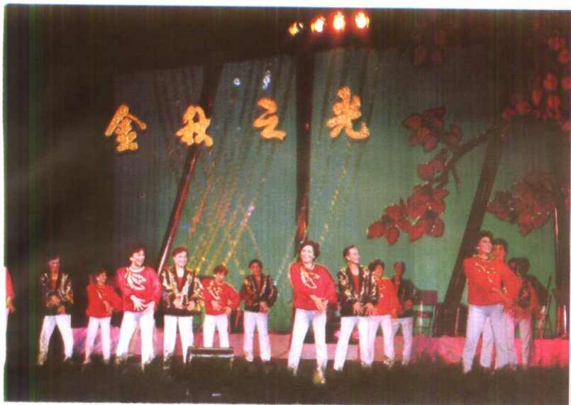
为庆祝中华人民共和国成立40周年，人事部举办了“金秋之光”老干部联欢会，图为中国统配煤矿总公司中老年舞蹈队在表演。