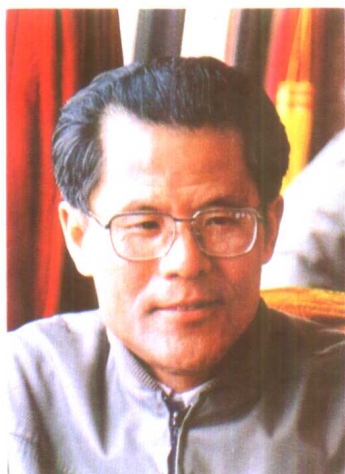
赵宗肅 1989年12月任 人事部副部长