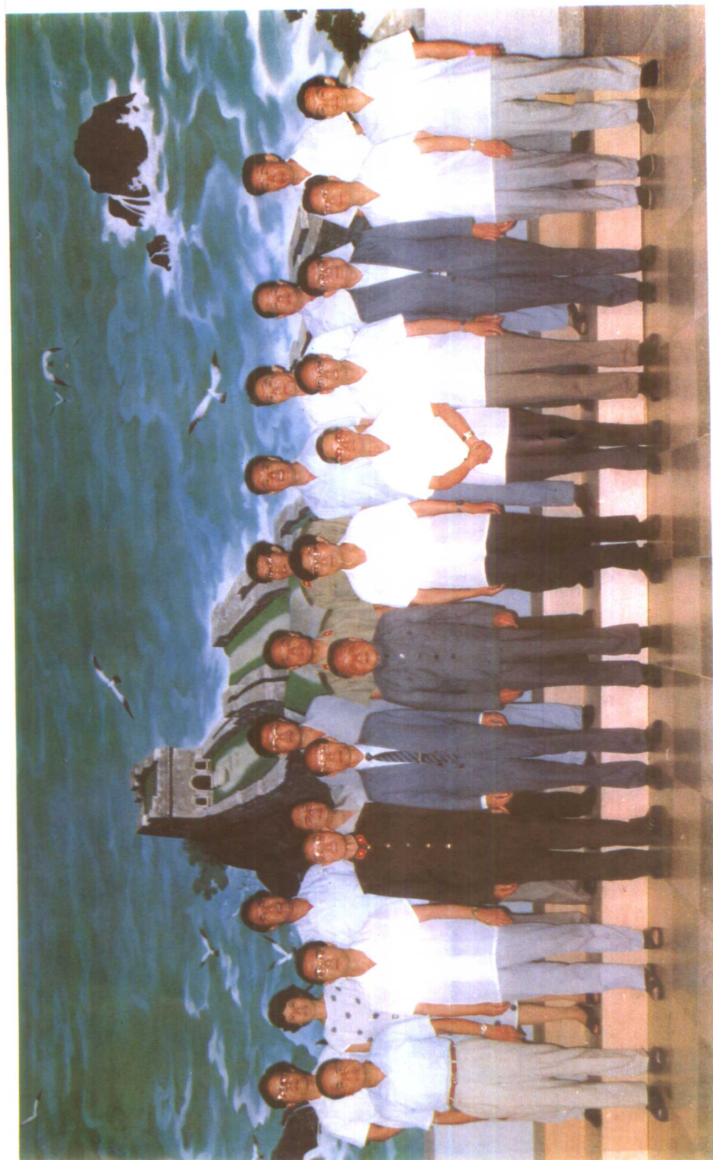
邓小平等中央领导同志与专家在一起合影留念