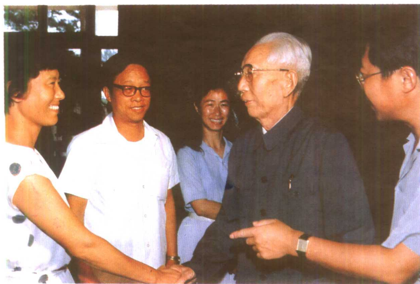
左：王震同志与专家亲切交谈。