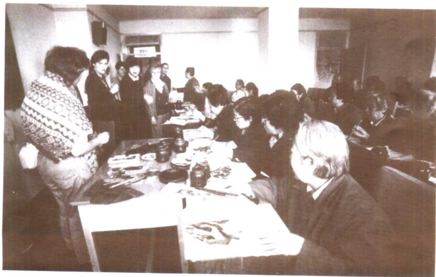
外国朋友参观铁道部老年大学。