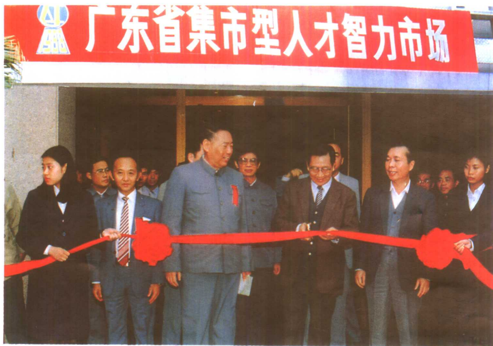
1988年12月7日，广东省副省长匡吉为广东省集市型人才智力流动机构成立剪彩。