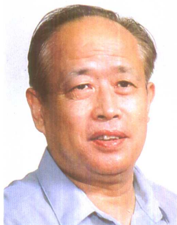
张汉夫 1988年5月任 人事部副部长