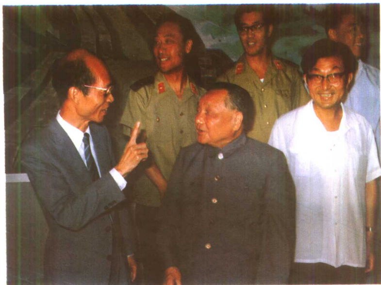
上、右：邓小平同志在北戴河与专家在一起。