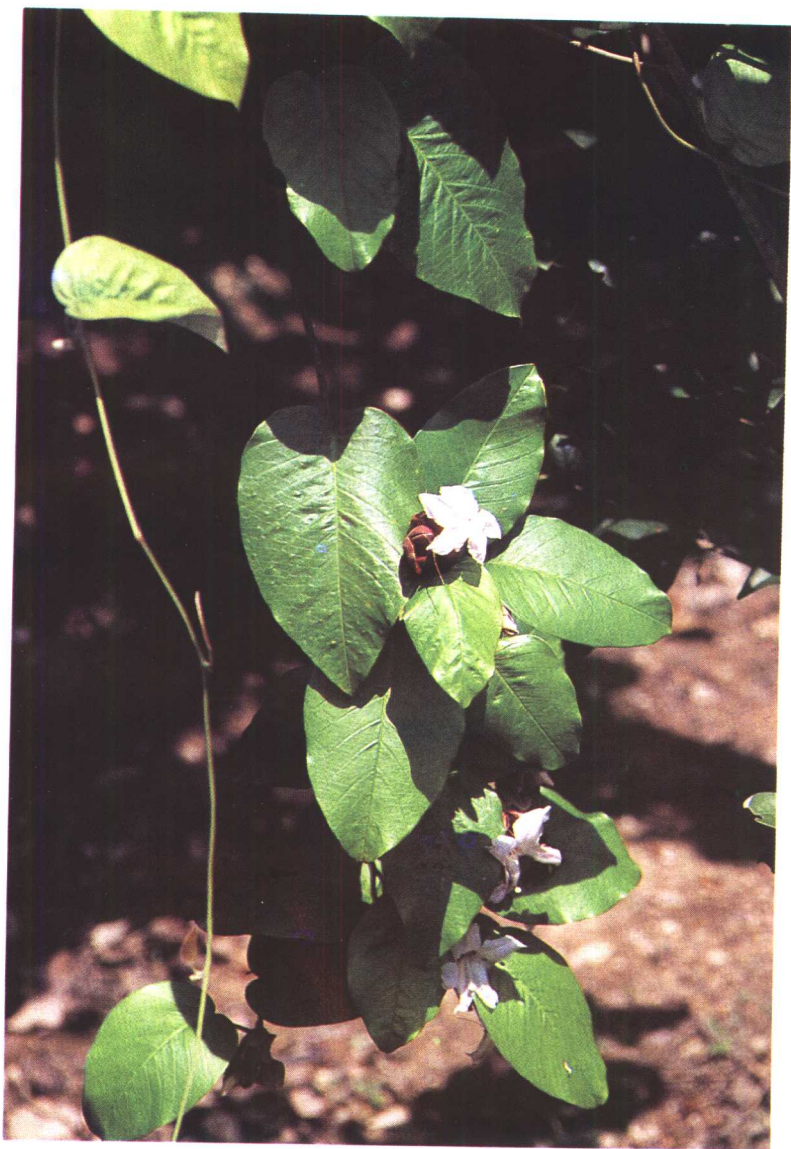
图 1 一匹绸