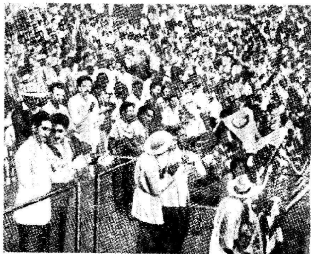
4. 在哈瓦那举 行的和平大 会(1951年)