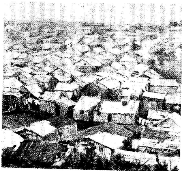
3. 哈瓦那市郊 的貧民茅舍