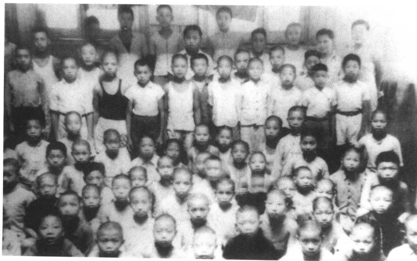
工华难童收容所难童留影 摄于1938年8月上海