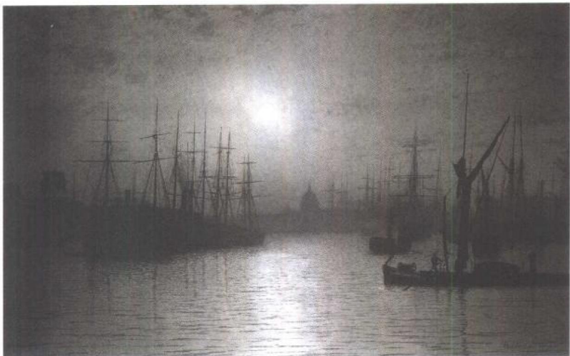
5. 格里姆肖《夜幕降临泰晤士河》

构造一个本来没有的题目……事实也许是,根本就没有什么美学,而只有文学批评、音乐批评的原则。”(W. Eiton, ed. Aesthetics and Language , p. 50.)艺术既然作为情绪感叹难以论说,有文字凭据可供分析的便只有批评了。于是美学便只能是元批评学(meta-criticism)或分析美学(analytic aesthetics)。这些反对传统美学或主张取消美学的观点、论调当然也并不完全一致,例如艾耶尔认为美学仍然可以研究审美的心理学和社会学上的原因,例如有的人认为历史上的美学理论在一定情况下强调出艺术的某个方面,仍有积极作用,等等。但总的说来,这派哲学否认美学能作为一门有关价值判断的理论学科或哲学而存在,而哲学本身,在他们那里本就是语言分析,如维特根斯坦所说:“关于哲学大多数命题并不是虚假的,而只是无意思的,因为我们根本不能回答这类问题,我们只能说它们的荒唐无稽。哲学家们的大多数问题和命题是由于我们不理解我们语言的逻辑而来的。”(参阅维特根斯坦《逻辑哲学论》,第44页,北京,商