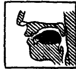
图 12 [e:]