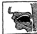
图 14 [v][f]