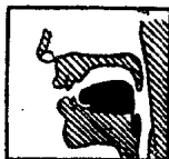
图 8 [u:]