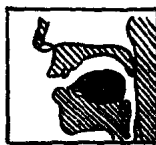
图 5 [ɑ:]