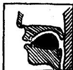
图 2 [ɪ]