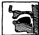
图 17 [o]