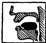
图 6 [ɔ]