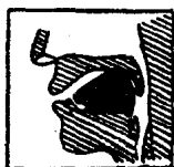
图 16 [d][t]