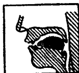
图 10 [ʌ]