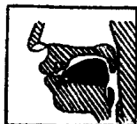
图 9 [u]