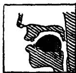
图 4 [æ]