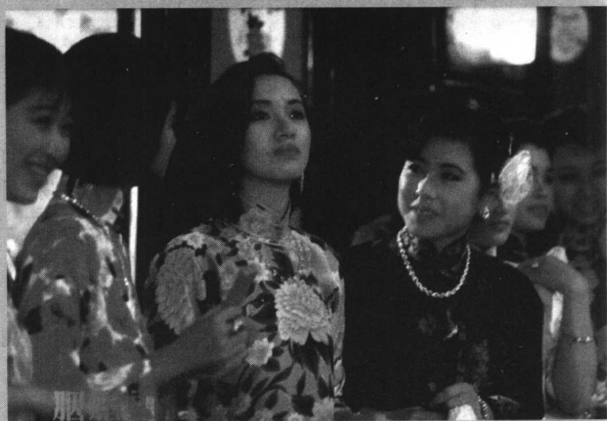
如花：“我便是当年倚红楼红牌阿姑 .....”