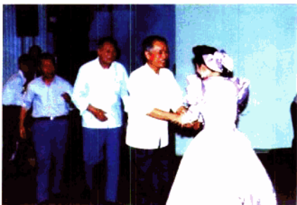
广东省委书记冯林岩(左二)天我校副董事长(左一)