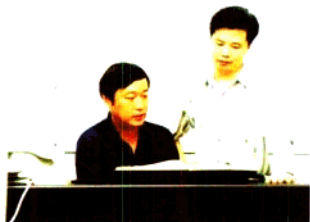
系领导在研究多媒体教学改革方案

系内开设了声乐和合唱指挥两个专业，实行双学位制。专业设置非主要课程有：声乐、钢琴、作曲、音乐写作、管弦乐配器。此外，还有作曲、音乐理论、计算机辅助作曲和钢琴等课程。音乐专业学生除理论作曲基础课外，还有计算机作曲、音乐技术制作、音乐录音、乐队指挥教学、钢琴一级证书、广音考级证书以及考级课程等课程。