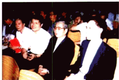
原广东省委常委杨应祥(右二)来我院指导工作