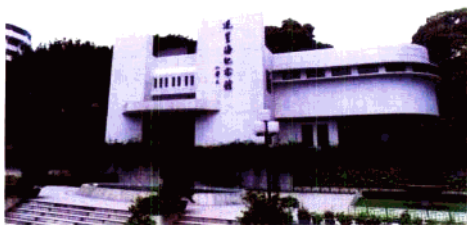
图书馆并作为学生会总部设在第三层， 成为校园内的一道亮丽风景线。