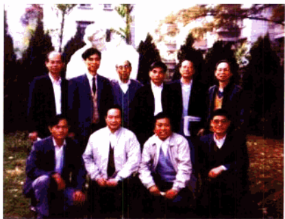
广东省副省长刘仰乾(后排右二)天我校领导合影