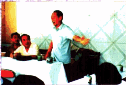
中国音乐家协会主席李焕之来我院指导工作