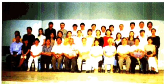
理论作曲系全体教师合影

理论作曲系有一支结构合理的师资队伍，共有教授5名，副教授5名，他们学贯中西，功底深厚，教学经验丰富，除系内各岗位外还有一大批音乐创作和指挥人才，其中不少人已成为音乐院校、文艺团体、广播电台、电视台和有关单位的重要骨干力量。