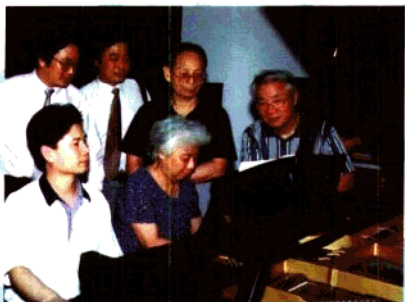
系领导与教师们在学习作品