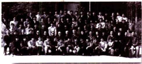
一、照片群出的回忆 二、广州音乐学院第一届本科毕业生全体留影