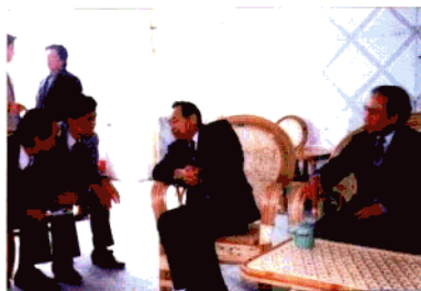
原广东省副省长丁蔚山(中)来我院视察指导工作