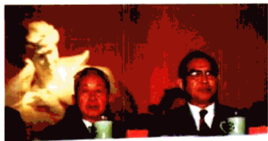
原中联委委员王晋涛(左)、文化部副部长陈晓晴 在星海音乐学院命名大会主席台上