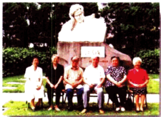
高专创建初期部分院系领导合影