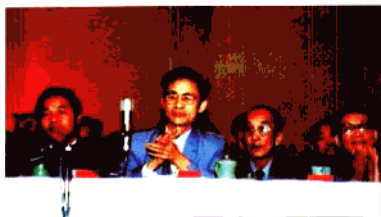
原广东省委宣传部长黄浩(左一)、中国音协副主席 李凌(右二)、原广东省委宣传部副部长杜耿坚(左二) 在星海音乐学院命名大会主席台上。