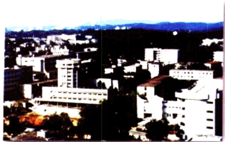
空中俯瞰学院全景