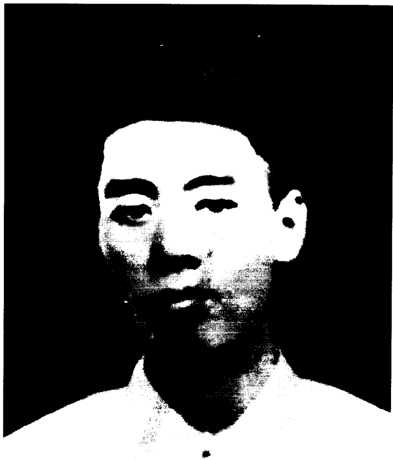
五四运动和南开大学时期的周恩来。