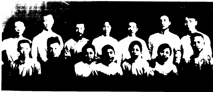
1919年9月，周恩来等在天津发起成立“觉悟社”。这是部分社员的合影，后排右一为周恩来。