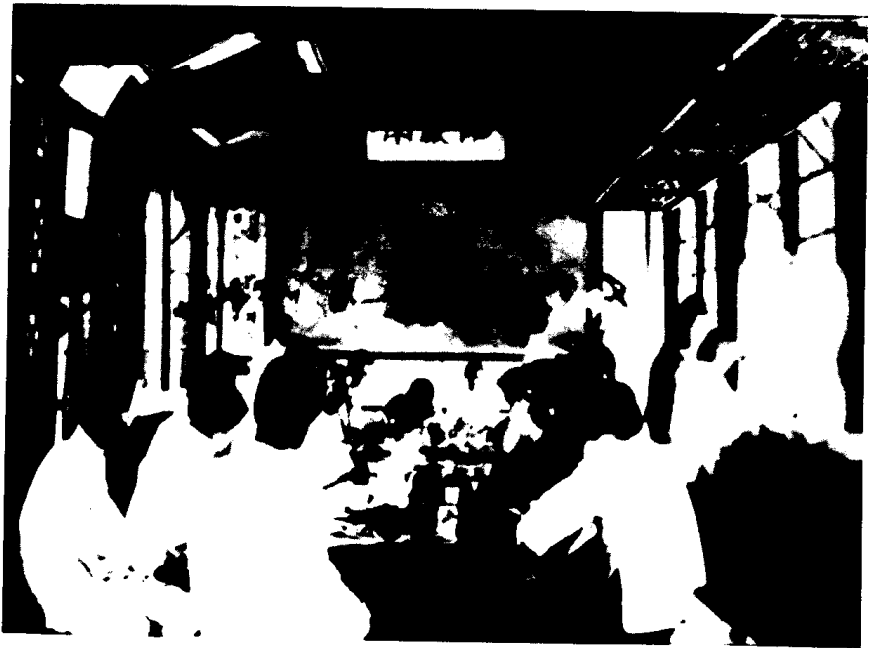
1920年8月16日觉悟社成员十一人到北京，邀请少年中国学会等四个进步团体在陶然亭集会，商讨联合斗争问题，李大钊应邀赴会。图中近镜头者为周恩来。