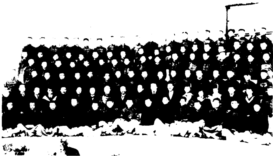
1919年9月25日，南开大学开学纪念留影，后排左一为周恩来。