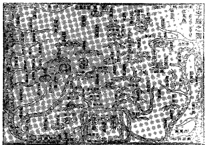
图四 [宋] 周应合《景定建康志》卷首《江宁县之图》 市镇镇名 图景醒目