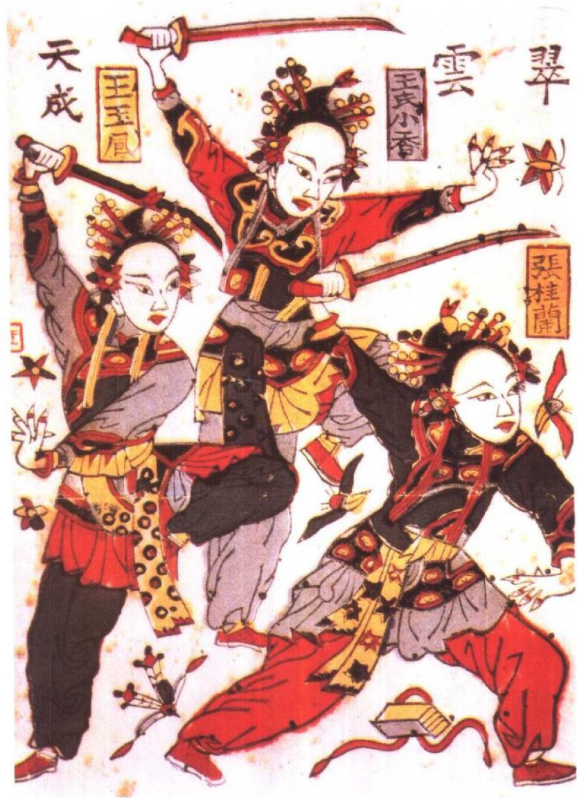
《三女侠》晚清（中国美术全集·绘画编）