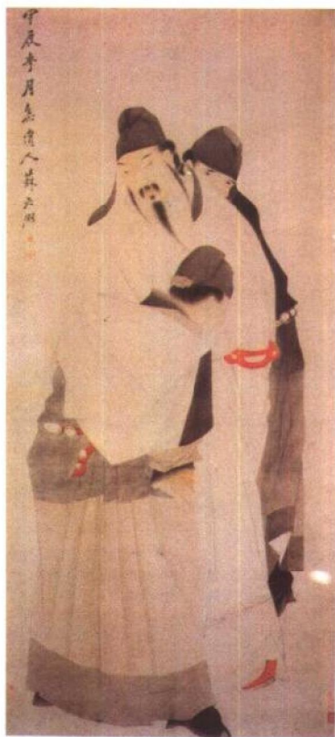
《太白醉酒图轴》清·苏六朋 (中国美术全集·绘画编)