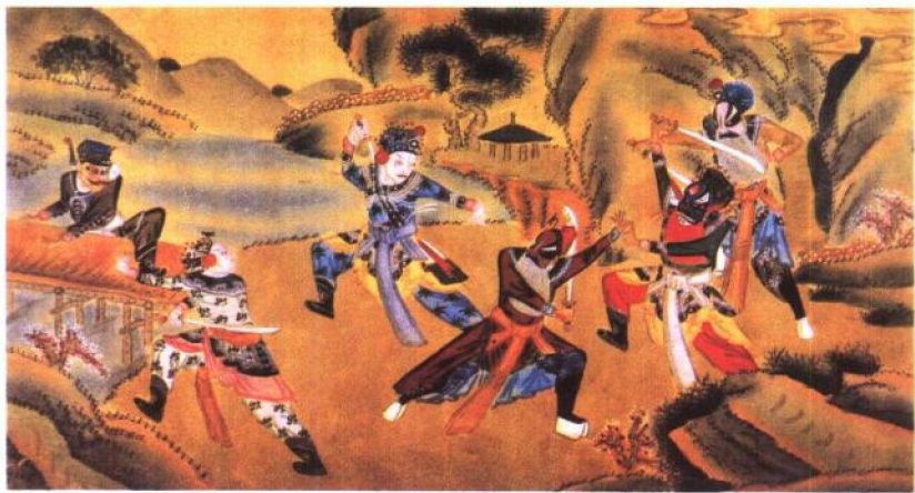
《拿花蝴蝶》晚清 (中国美术全集·绘画编)