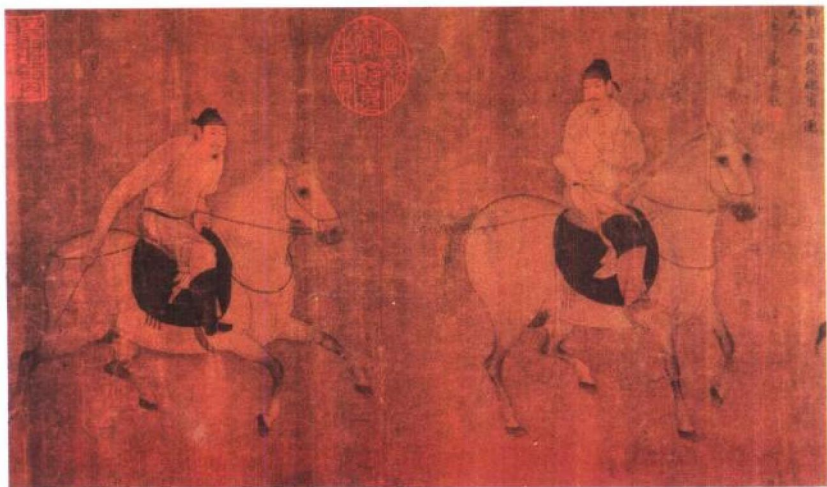
《游骑图卷》唐（中国美术全集·绘画编）