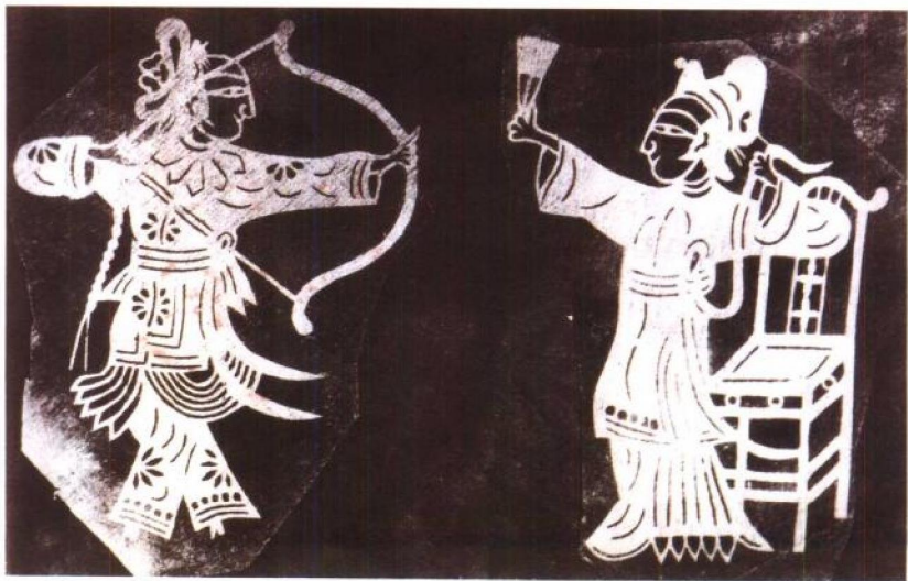
《侠女开弓》晚清 (中国美术全集·工艺美术编)