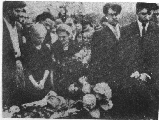
下左： 巴斯特納克去世，親友、同志圍棺瞻仰遺容。