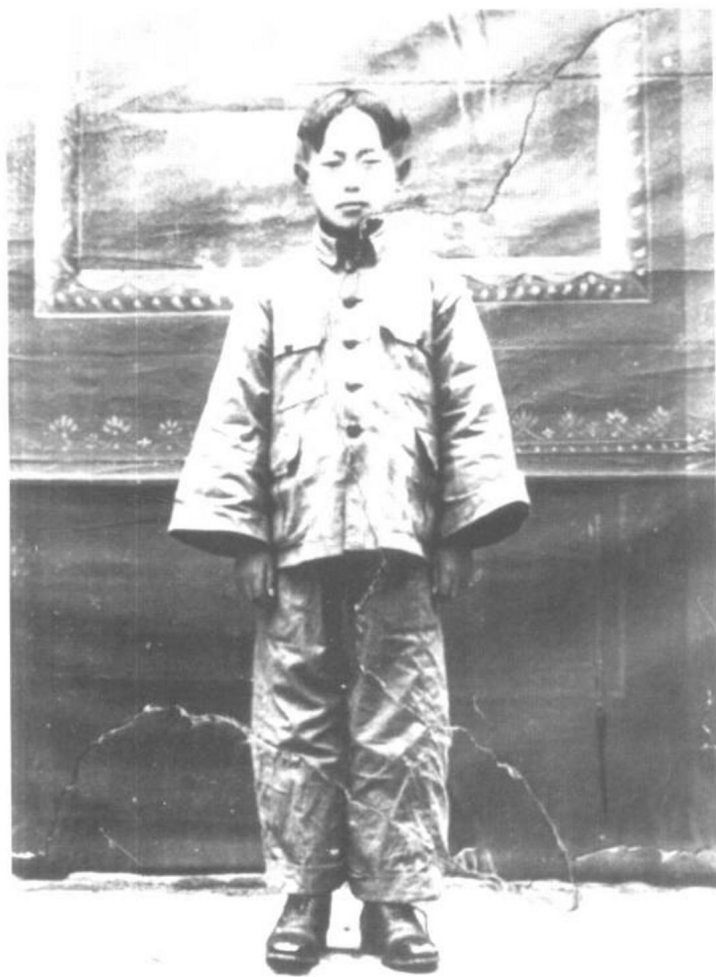
十一岁时(约1930年)于河北丰宁