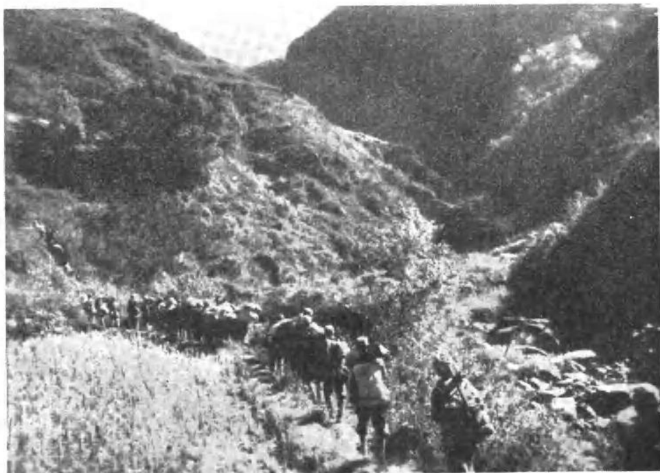
晋冀鲁豫野战军挺进大别山