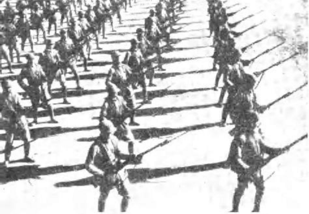
解放区军队的 练兵运动