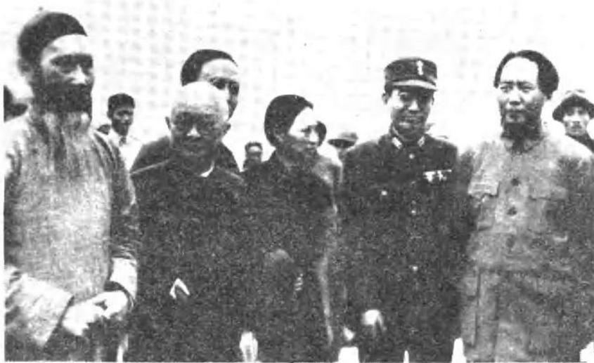
1946年10月11日，毛泽东返回延安时，在重庆机场与欢送者合影。 自左至右：张澜、邵力子、郭沫若、傅学文、张治中、毛泽东。