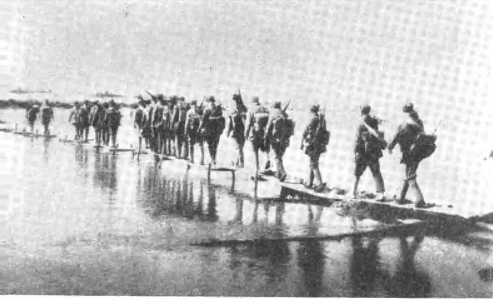
太行兵团挺进豫西