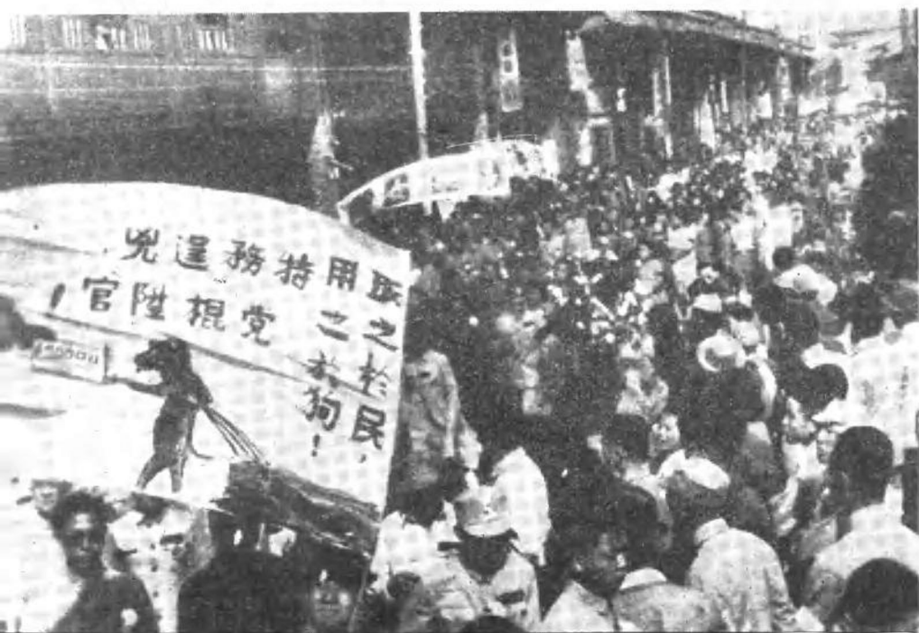
昆明学生抗议反动派的暴行