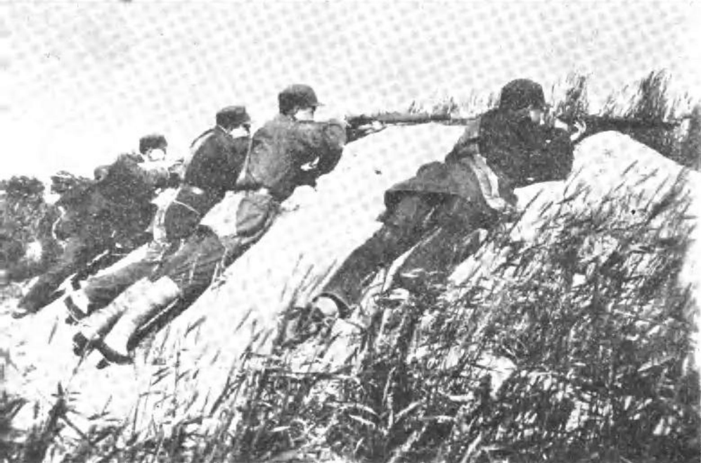
苏中解放军迎击敌人