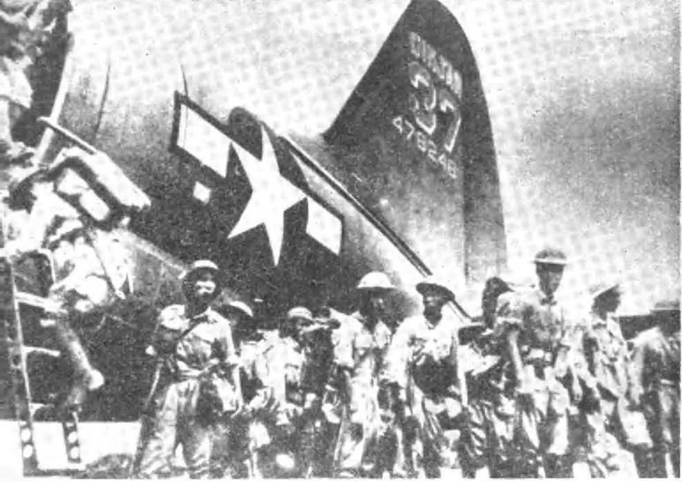
美蒋发动内战罪证之一，空运军队。