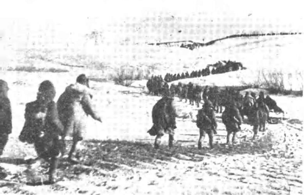
东北解放军南下松花江