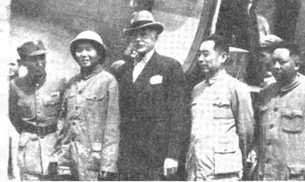
1946年8月28日，中共代表团毛泽东、周恩来、王若飞赴重庆谈判前，在延安机场合影。左起第一人和第三人为国民党代表张治中、美国大使赫尔利。