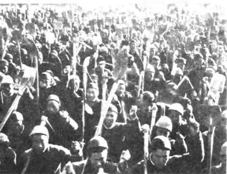
解放区农民誓为保卫胜利果实而斗争