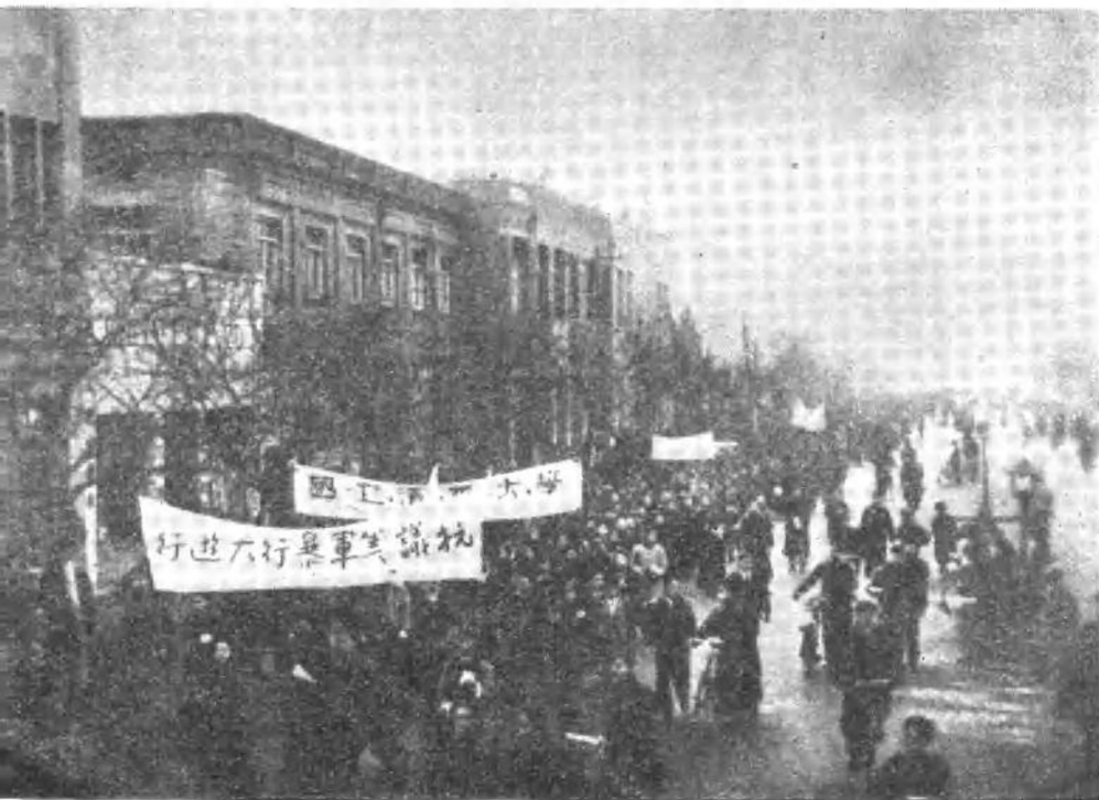
北平学生抗 议美军暴行