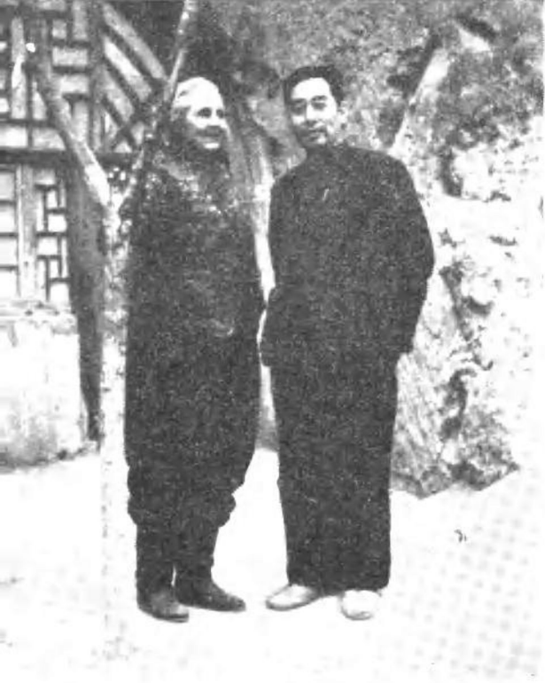
1946年，周恩来和美国 进步作家安娜·路易斯· 斯特朗在延安合影