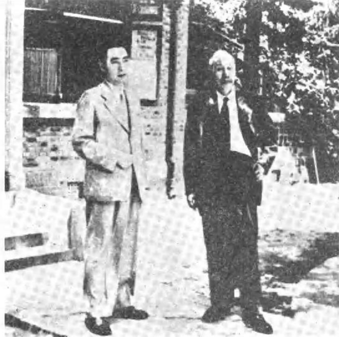
周恩来、董必武 在南京梅园新村 三十号院内合影