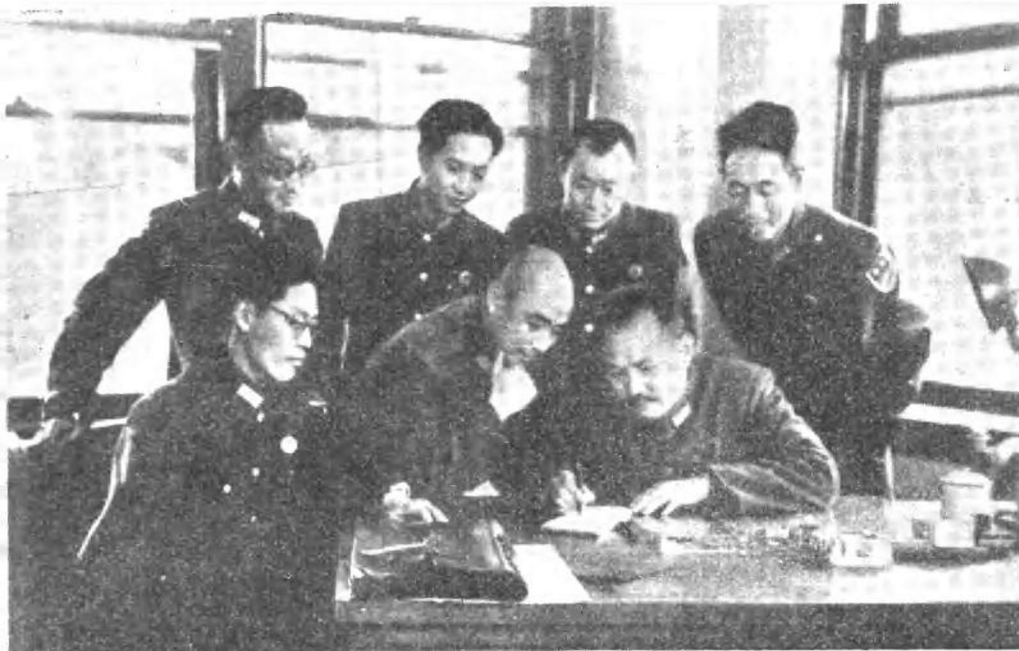
北平军调部中共代表叶剑英与工作人员在研究室