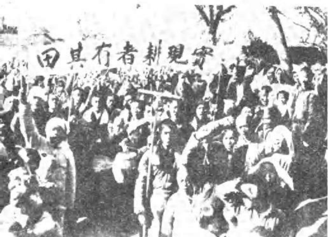
五四指示颁布后，解放区农民实行土地改革