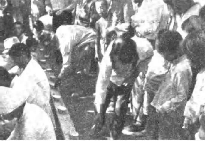
翻身农民 在投票选 举自己的 村政权