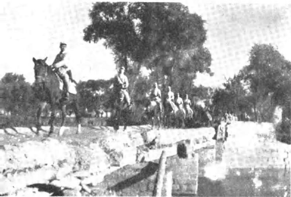
华东野战军挺进豫皖苏平原