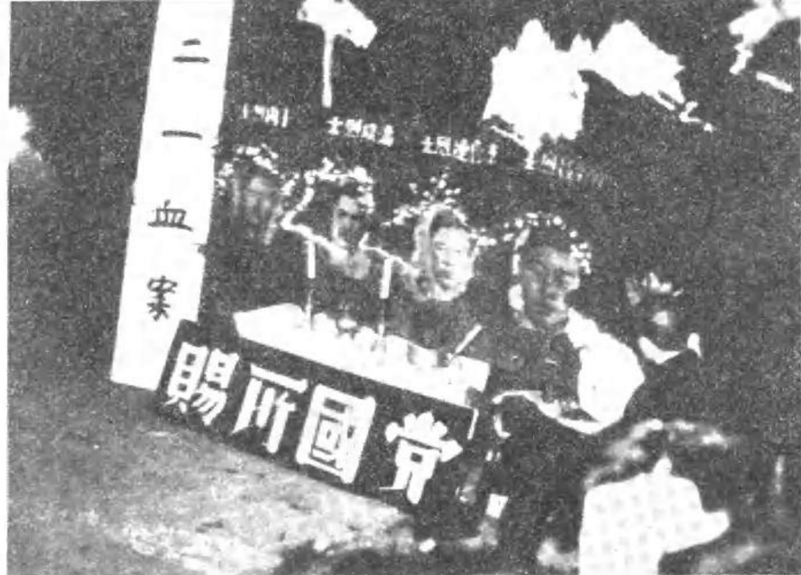
二·一血案烈士的灵堂