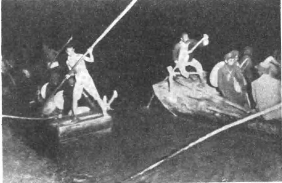
晋冀鲁豫野战军强渡黄河