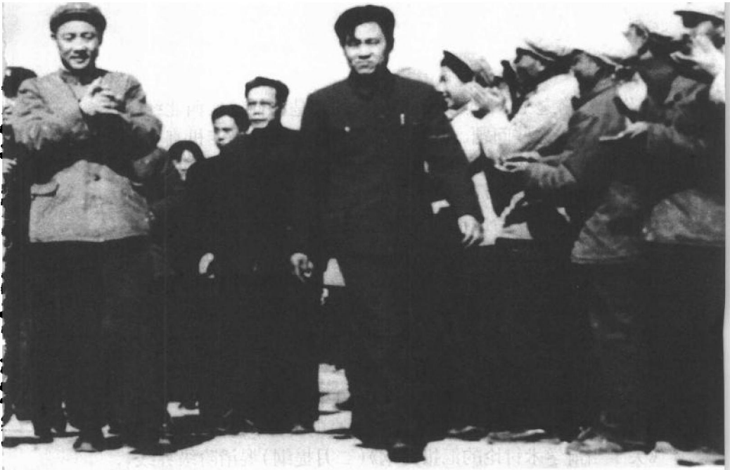
◎ 1966年3月，父亲到西北视察工作。这是他在宁夏，是“文革”爆发前最后的照片之一