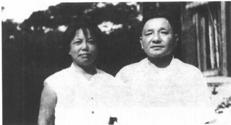
◎ 1964年夏天在北戴河。父母亲在“文革”前最后的合影

书都不能看。母亲觉得一定发生了什么事情，但不敢问。父亲也是什么都不说，整日沉着脸，少有的严肃。12月10日，中央用专机把罗瑞卿夫妇接到上海后，毛泽东派周恩来和邓小平找罗瑞卿谈话。那天，父亲叫母亲，说：“今天我们去看看罗瑞卿。你也去，看看郝治平，劝劝她。”在汽车上，母亲看见父亲和周恩来都沉着脸不说话，她虽不明就里，但心中甚感紧张。到了罗瑞卿被隔离的地方，周恩来、邓小平与罗瑞卿在楼下谈话，母亲与郝治平上楼。母亲对郝治平只说了一句：“你放宽心些。”便控制不住地哽咽起来。后来批邓时，造反派曾抓住此事，说邓小平包庇罗瑞卿，说卓琳与郝治平抱头痛哭。