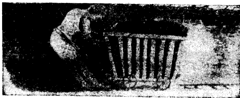
工业革命时的童工劳动

资产阶级为了争夺殖民地，相互间进行剧烈的火并，连续不断地进行侵略战争，千百万人遭到无辜的屠杀。在近代以前，从来没有这样大规模的毁灭、这样大规模的屠杀！