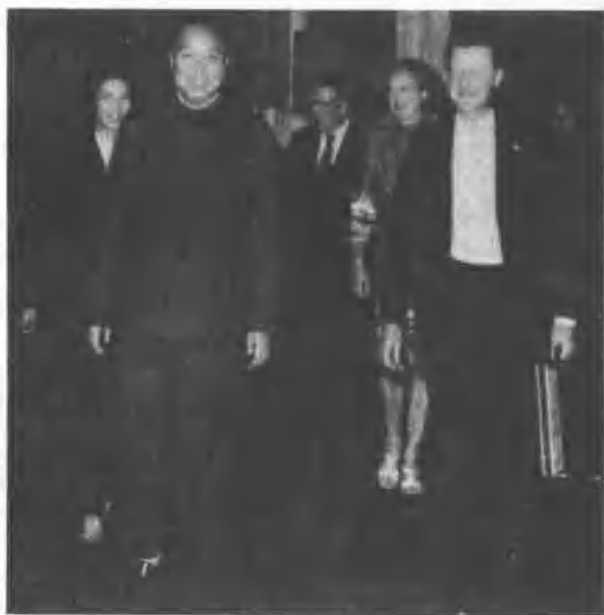
一九七八年華國鋒接見布熱津斯基。