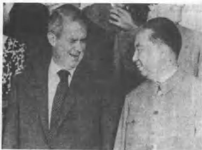
一九七七年華國鋒接見萬斯。