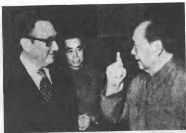
一九七三年毛澤東和基辛格談話，中為周恩來。