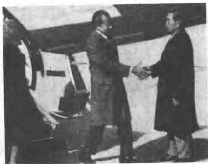
一九七二年尼克遜訪華，周恩來到機場歡迎。