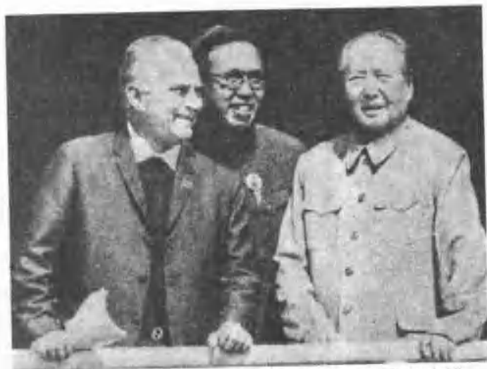
一九七〇年十月一日，毛澤東與美國名記者史諾 在天安門樓上。