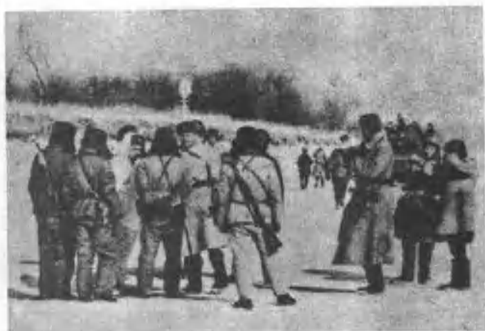
一九六九年三月，中蘇在邊境珍寶島發生衝突，影響中美關係。