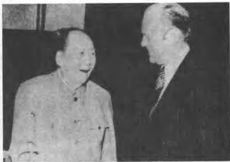
一九七五年毛澤東會見福特。