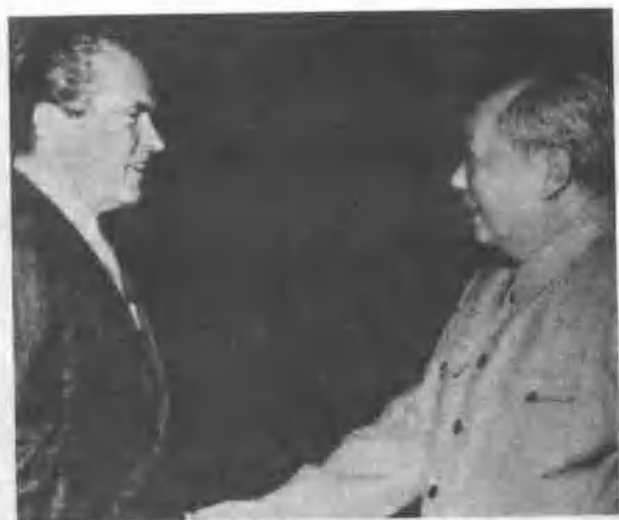
一九七二年毛澤東會見尼克遜。