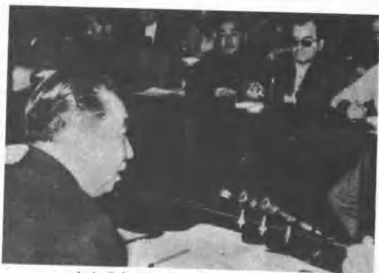
一九七八年十二月，華國鋒在北京召開 記者招待會宣佈中美建交。