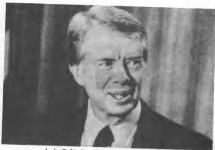
一九七八年十二月，卡達在華盛頓電視 螢光幕宣佈中美建交。