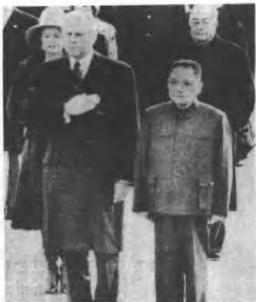
一九七五年福特訪華，鄧小平到機場迎接。