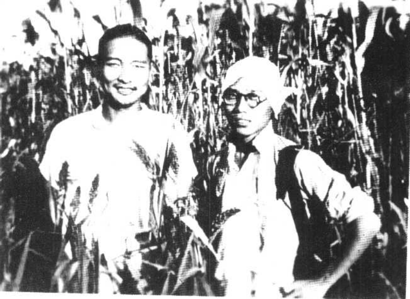
↑ 一九四五年魏巍(右)在冀中平原