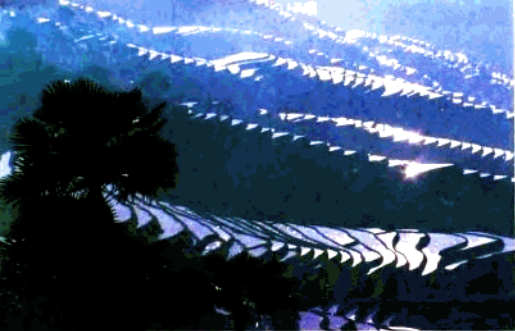
红河县哈尼族梯田