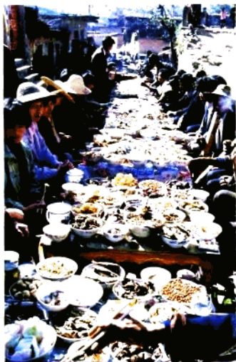
元阳县哈尼族“昂玛托” 节的长街宴