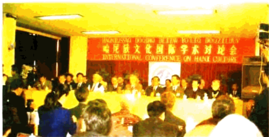
首届哈尼族文化国际学术讨论会开幕式