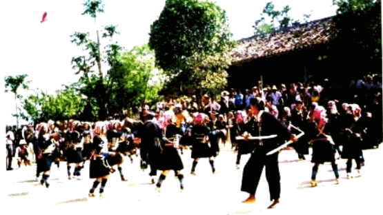
勐腊县哈尼族舞蹈