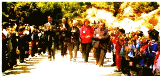
中外学者共庆国际非遗生日