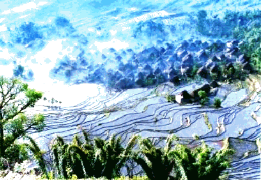
元阳县哈尼族梯田