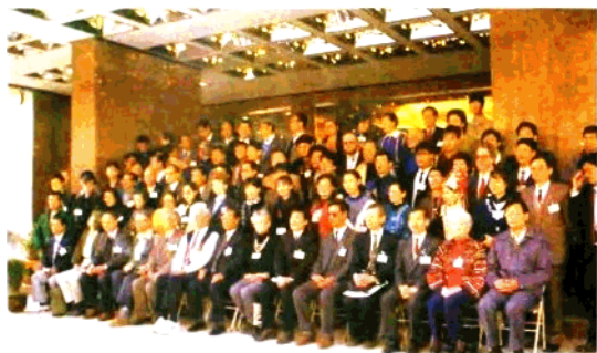
与会的部分中外学者