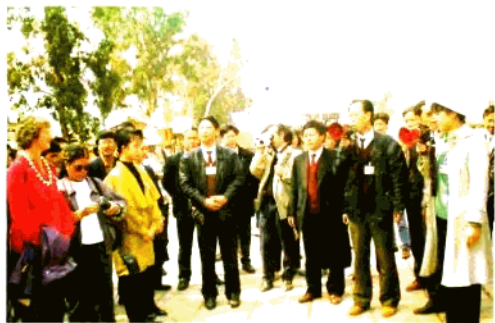
中外学者探讨国家级历史文化名城——建水。