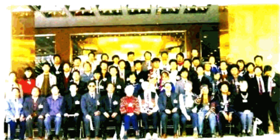
与会的部分中外学者