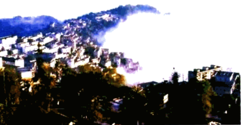
云蒸山城——元阳