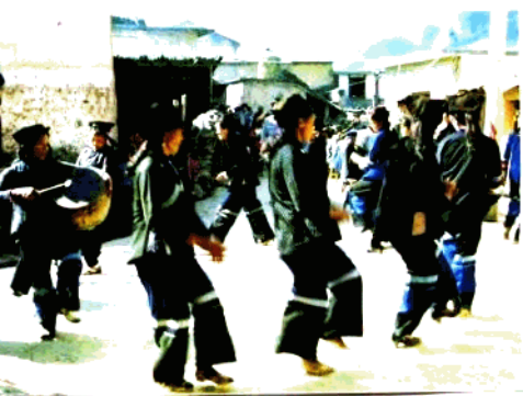
哈尼族传统舞蹈—乐竹舞