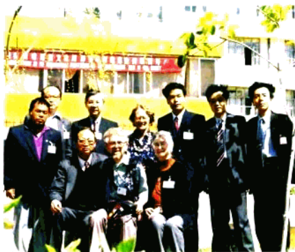
研究举办第二届哈尼族文化国际学术讨论会 有关事宜的中外学者