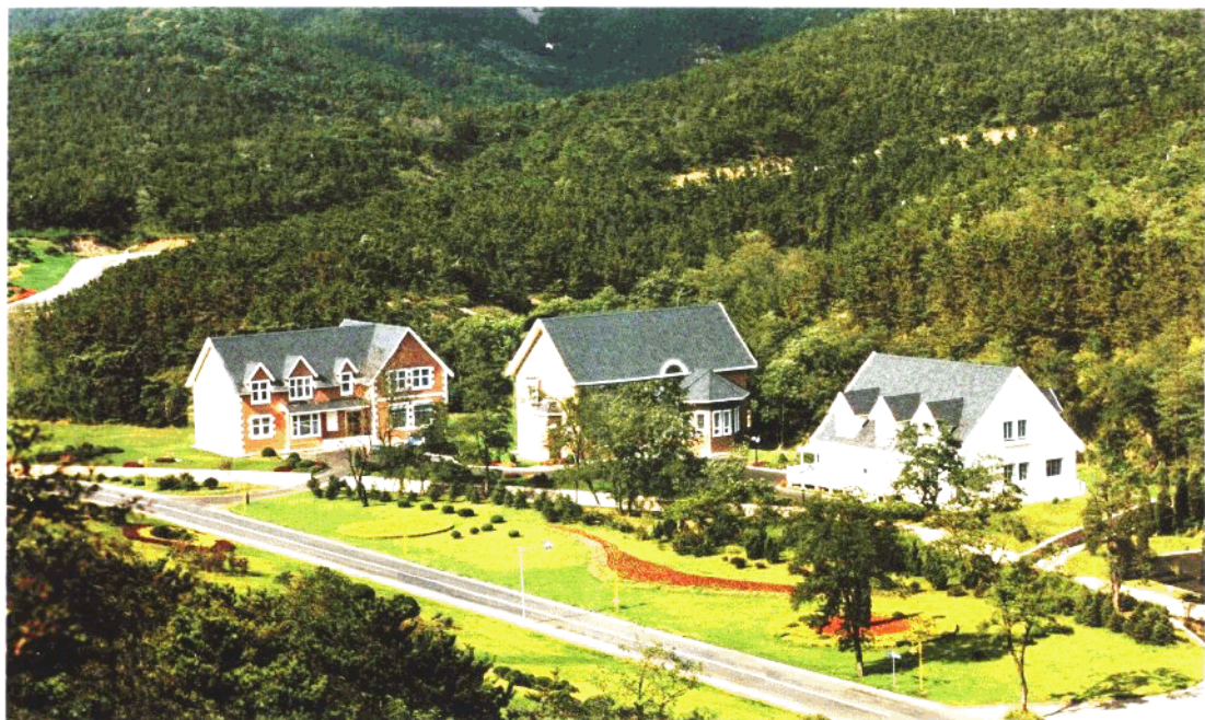
大连市棒種島別墅