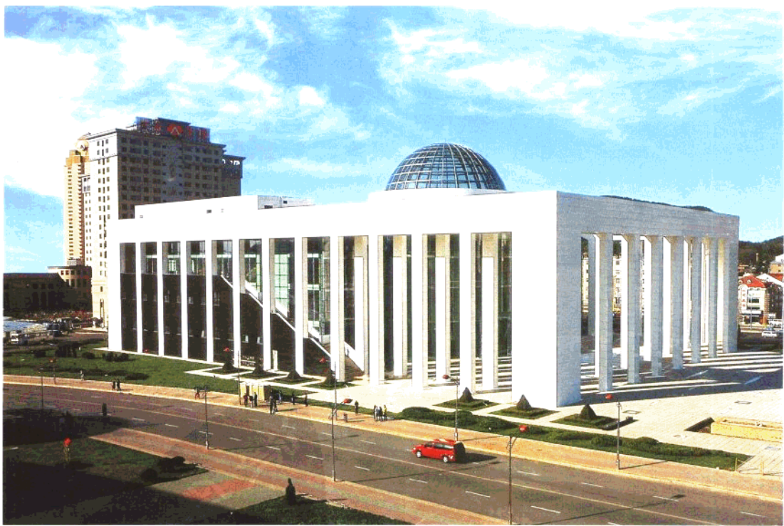
大连市现代博物馆