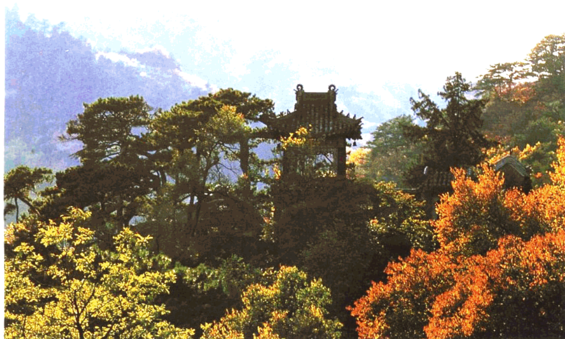
鞍山市国家级风景名胜区——千山