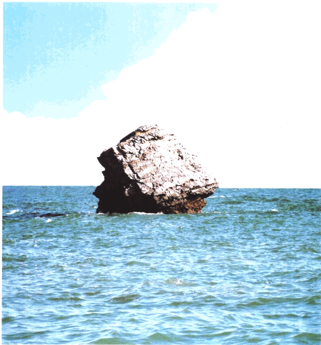
大连市海滨奇景——贝多芬头像