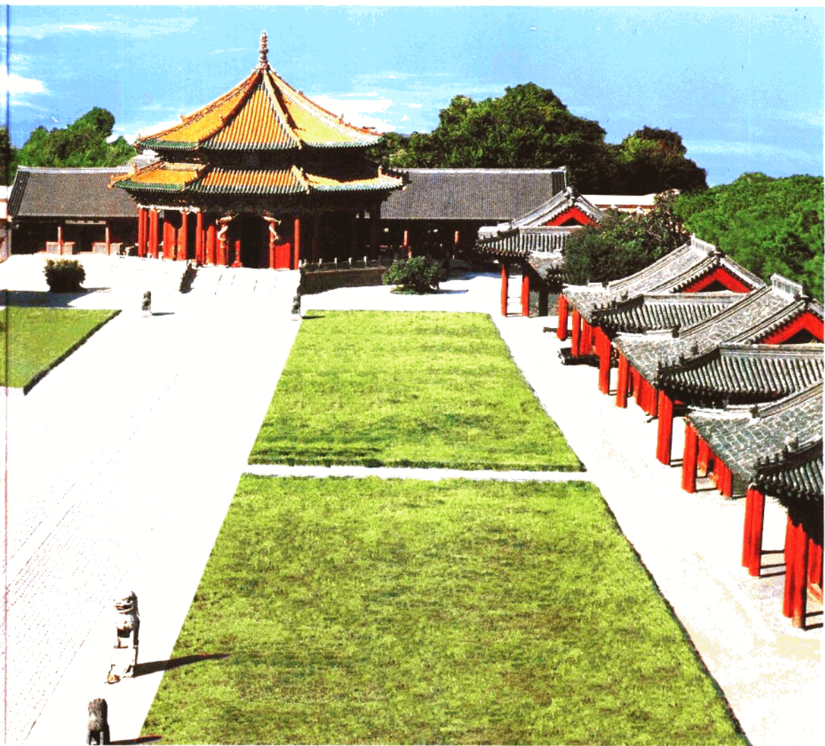
三百多年历史的中国最大清前皇宫——沈阳故宫