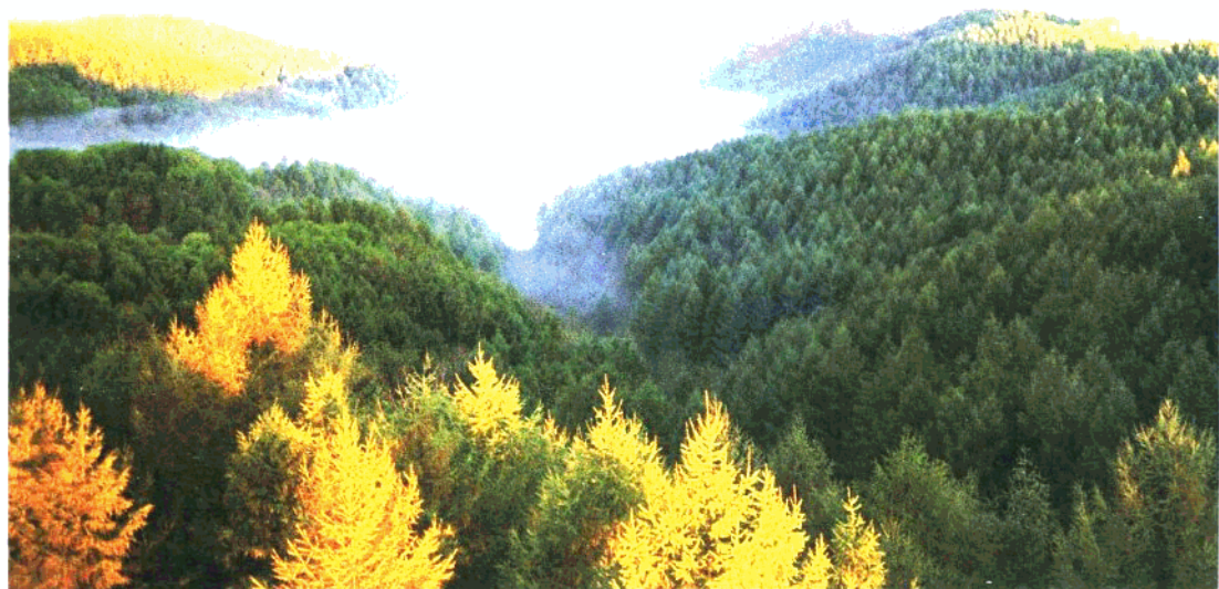
抚顺市猴石森林公园