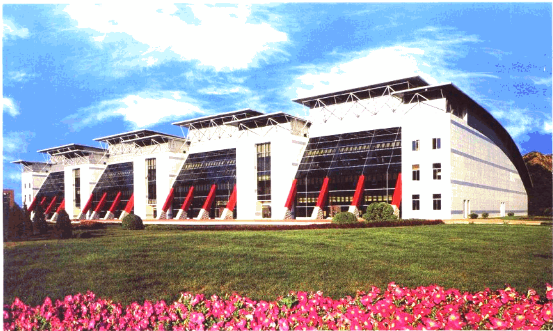
大连市国际网球中心