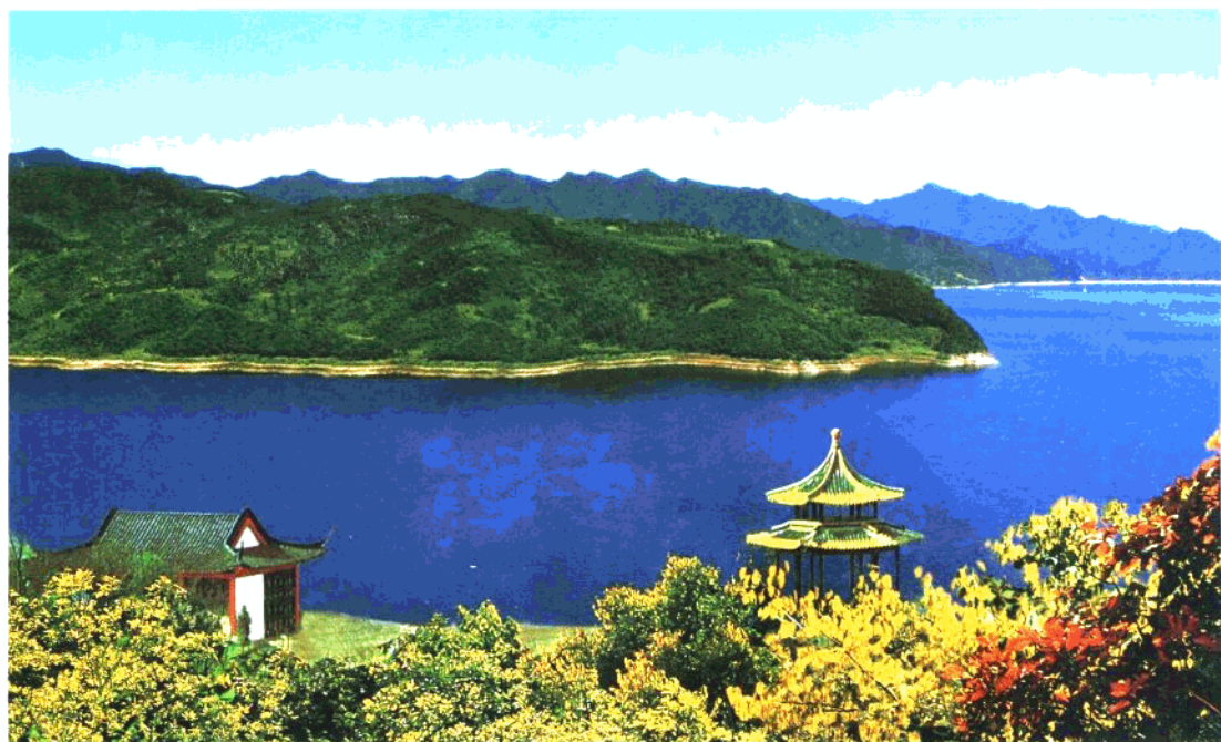
抚顺市大伙房水库小青岛