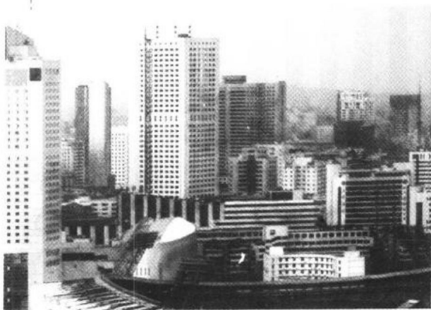
成都现代化的 楼宇林立

点也不差，只不过北京人侃大山可以在街心花园，在公园的大树下，在胡同里，而成都人摆龙门阵必须到茶馆。成都在茶馆里嗑了一