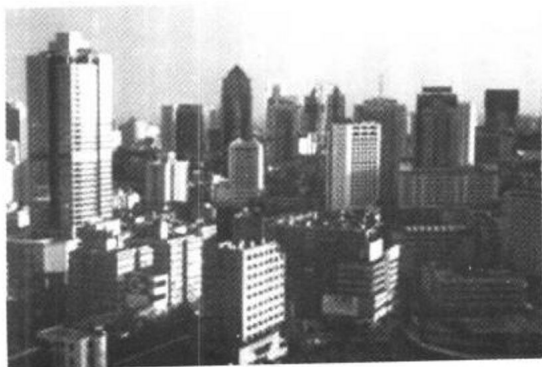
成都拥有都市的气派