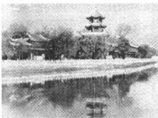
望江楼现在仍然是成都的标志