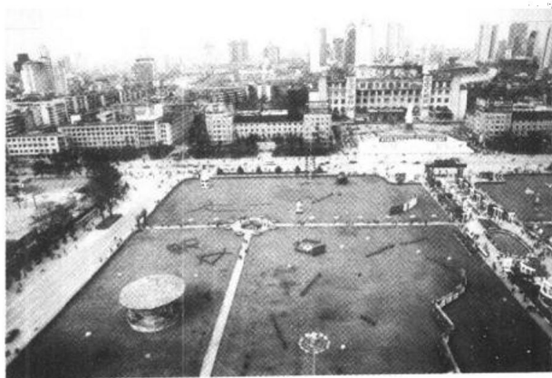
都市中心的两块大秧田

了大半江山。名胜古迹是外地游人在买票游览；高档场所里多是外地人在消费；连西南最大的荷花池批发市场也大多是附近