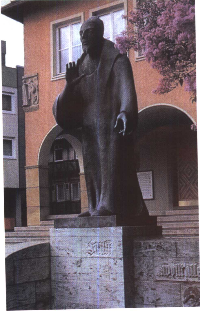
浮士德雕像：位于Knittlingen浮士德博物馆前