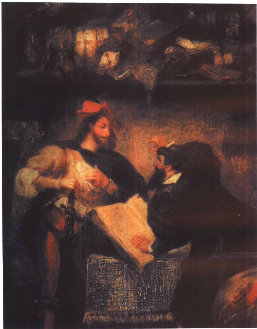
法国著名画家 E·德拉克罗瓦所绘油画《摩非斯陀再访浮士德》