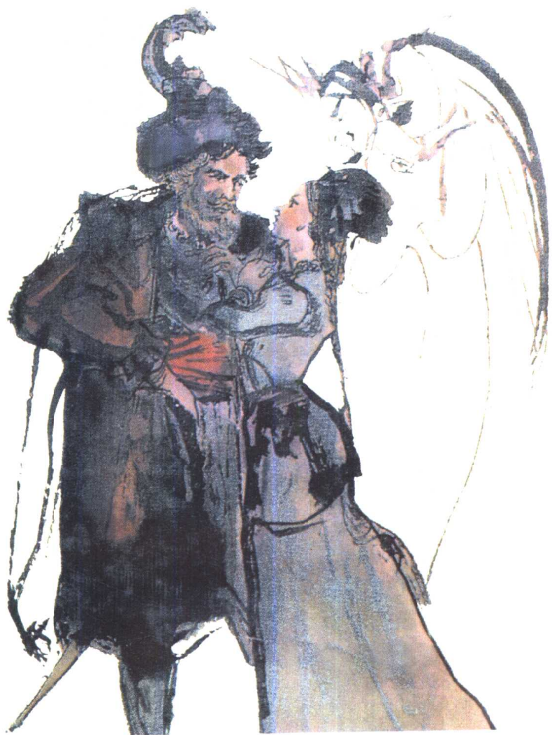
中国画家程十发为董译《浮士德》初版封面所作的画