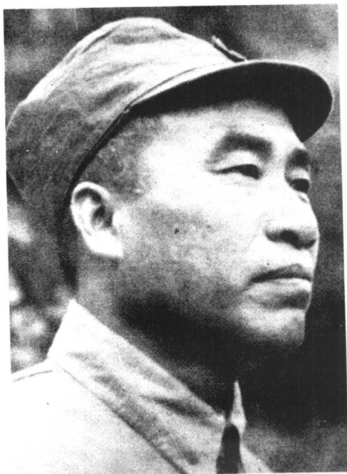
八路军总司令朱德