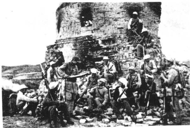
八路军攻克日军碉堡