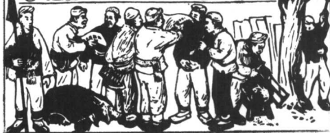
在边区找到了新家