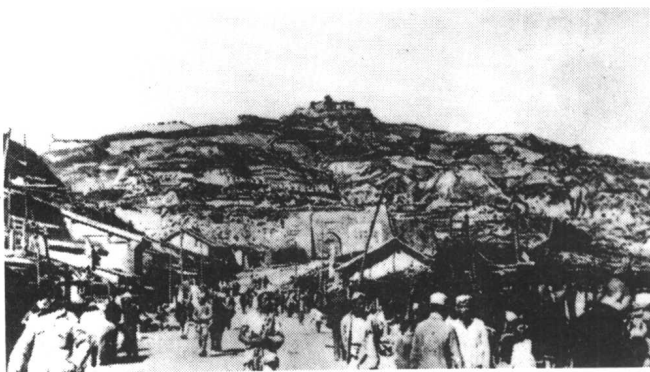
延安仅有的一条大街