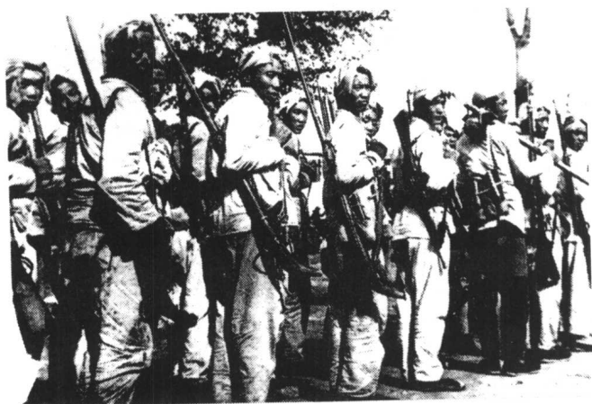
共产党领导下的在敌后作战的民兵