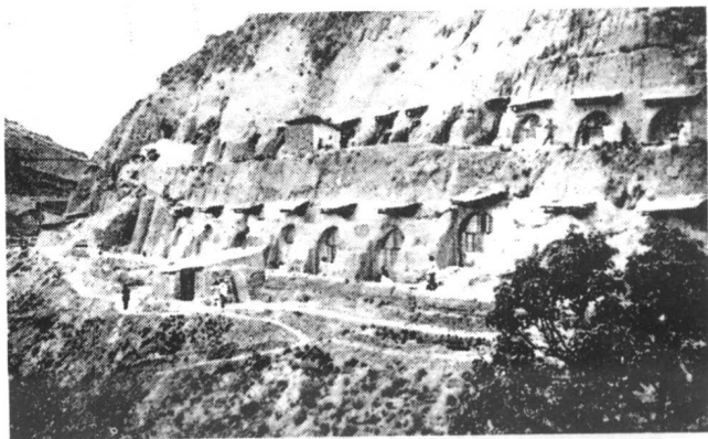
延安国际医院的窑洞病房