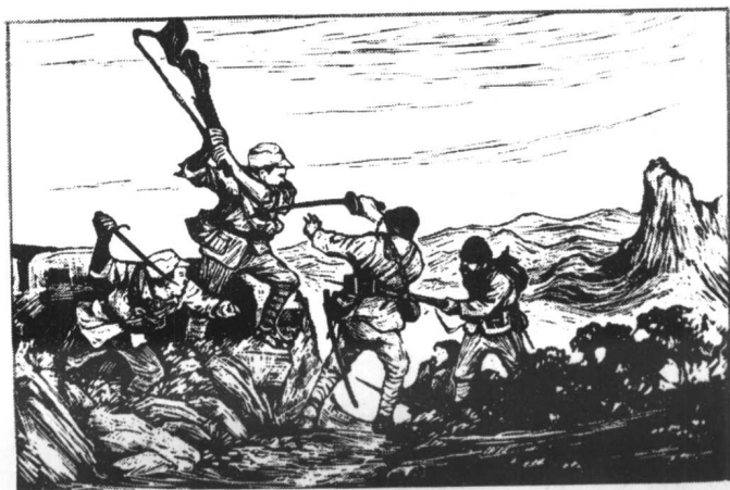
八路军与日寇搏斗