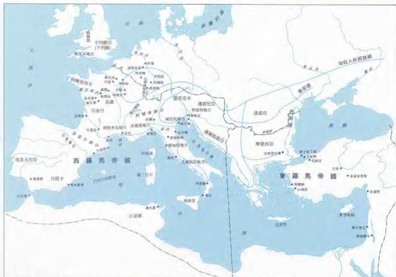
網頁圖片 亞登與夏娃 三世紀末的羅馬疆域圖。中央的樹根處有誘惑兩人的蛇。