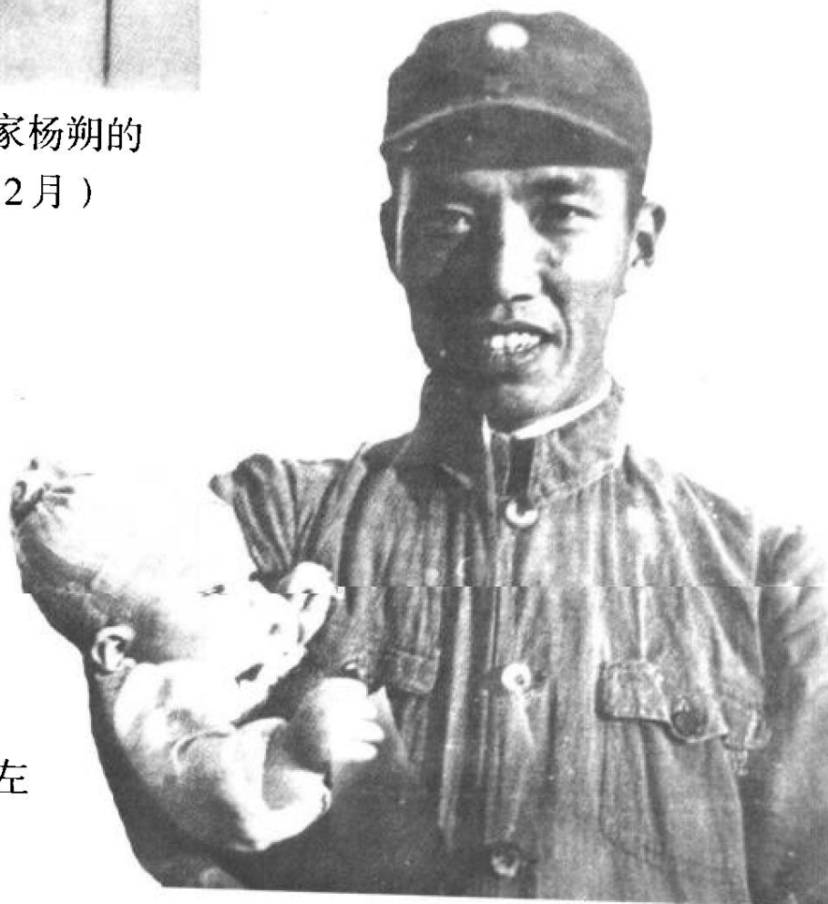
左权将军与女儿左 太北（1940年8月）