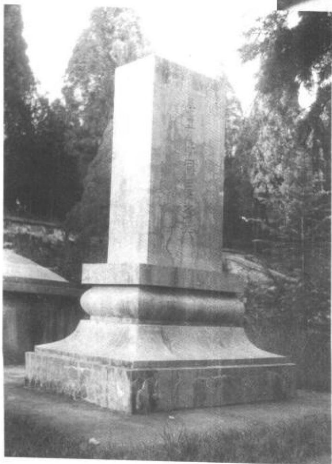
董必武题写的蔡升熙将军墓碑