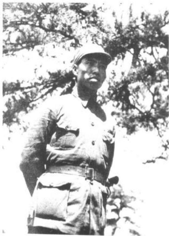
左权将军生前最后一幅 照片（1942年春）