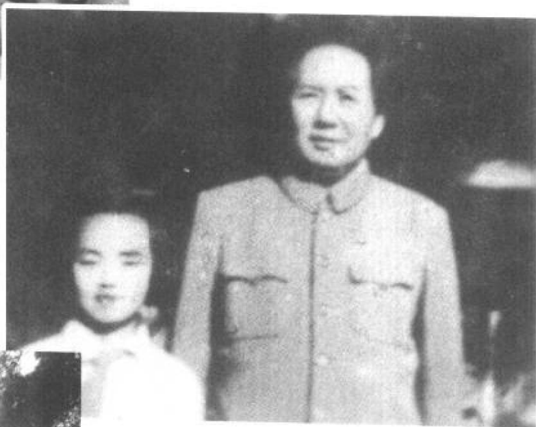
毛主席与左太北 在一起（1952年）