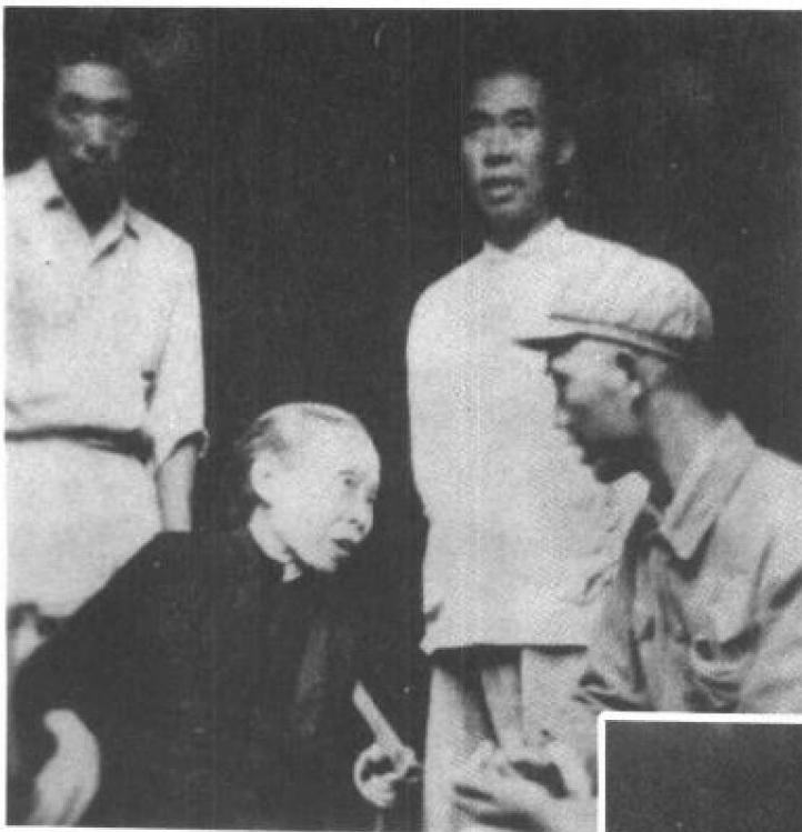
毛主席派人慰问左权 将军的母亲（1952年）