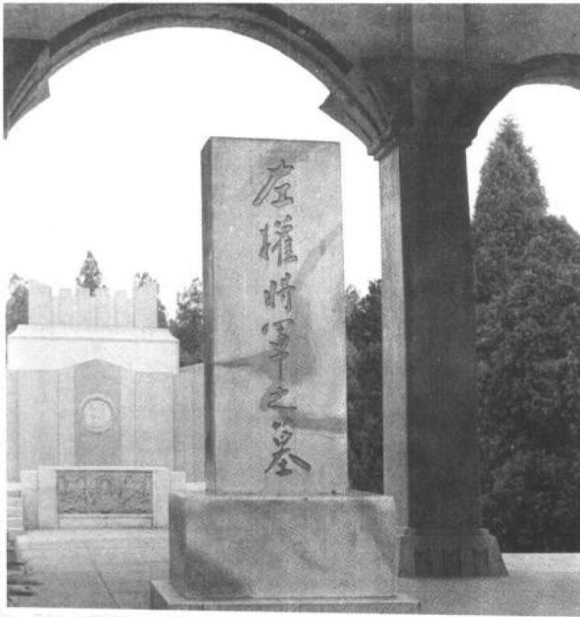
周恩来为左权 将军题写的墓碑