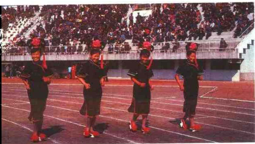
传统的“雪地走”竞赛

满族主要从事农业，散居城市的大多从事工业、教育。满族人民好歌舞，重礼节，在居住、饮食等方面，都保持有自己的民族特点。