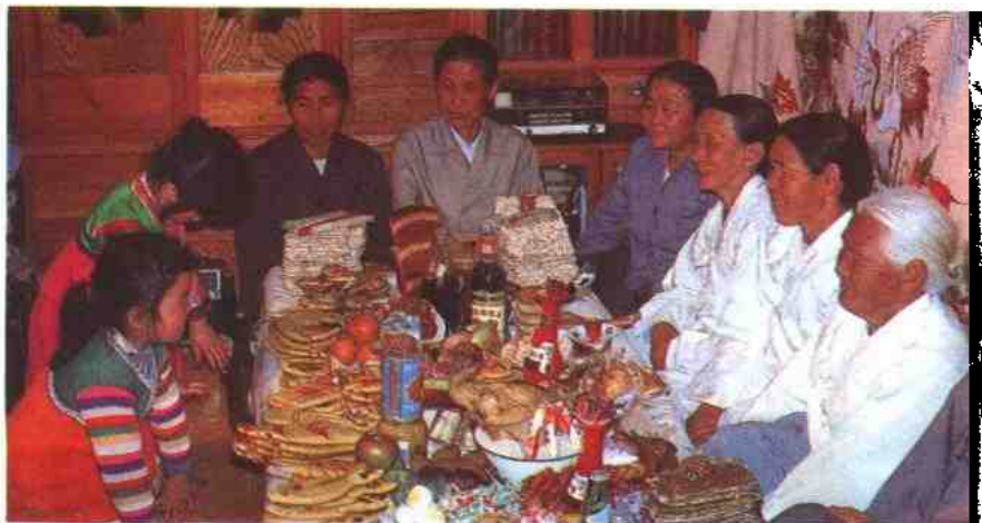
在老人节上向奶奶祝寿

朝鲜族具有优秀的传统民族文化艺术，有自己的语言文字，文化教育比较发达。每到节、假日或劳动之余，都喜欢用歌舞来表达自己的感情。朝鲜族还酷爱体育，足球运动普及，如女人们尤喜爱荡秋千和压跳板。朝鲜族喜着素白服装，年轻妇女则喜欢各色丝绸服饰；讲究卫生，注重礼仪，特别是尊老爱幼的美德，为人们所称赞。