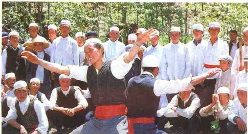
流行于西北回族民间的《宴席曲》

回族通用汉语文，主要从事农业，有的兼营牧业、手工业。回族还擅经商，尤以经营饮食业突出。回族的科学文化比较发达，历史上，在政治、经济以及国际间经济文化交流等方面都作出了贡献，出现过元代天文学家扎马鲁丁、建筑学家亦黑迭儿丁、政治家赛典赤瞻思丁以及明代航海家郑和、思想家李贽等。在近代和现代，回族杰出人物更是层出不穷。