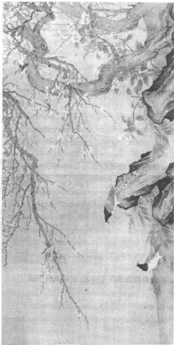
邓白教授为东莞市政府会议厅所画的“岭南春讯图”