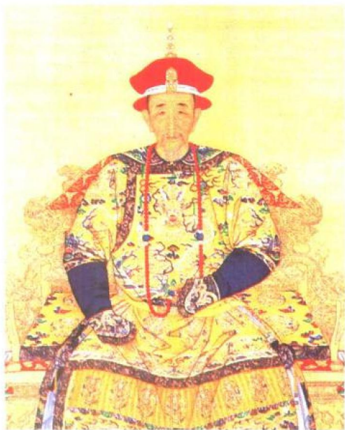
康熙帝 (1654—1722), 在加强多民族 国家的统一和 推动社会经济的 发展等方面 作出了重要贡 献。