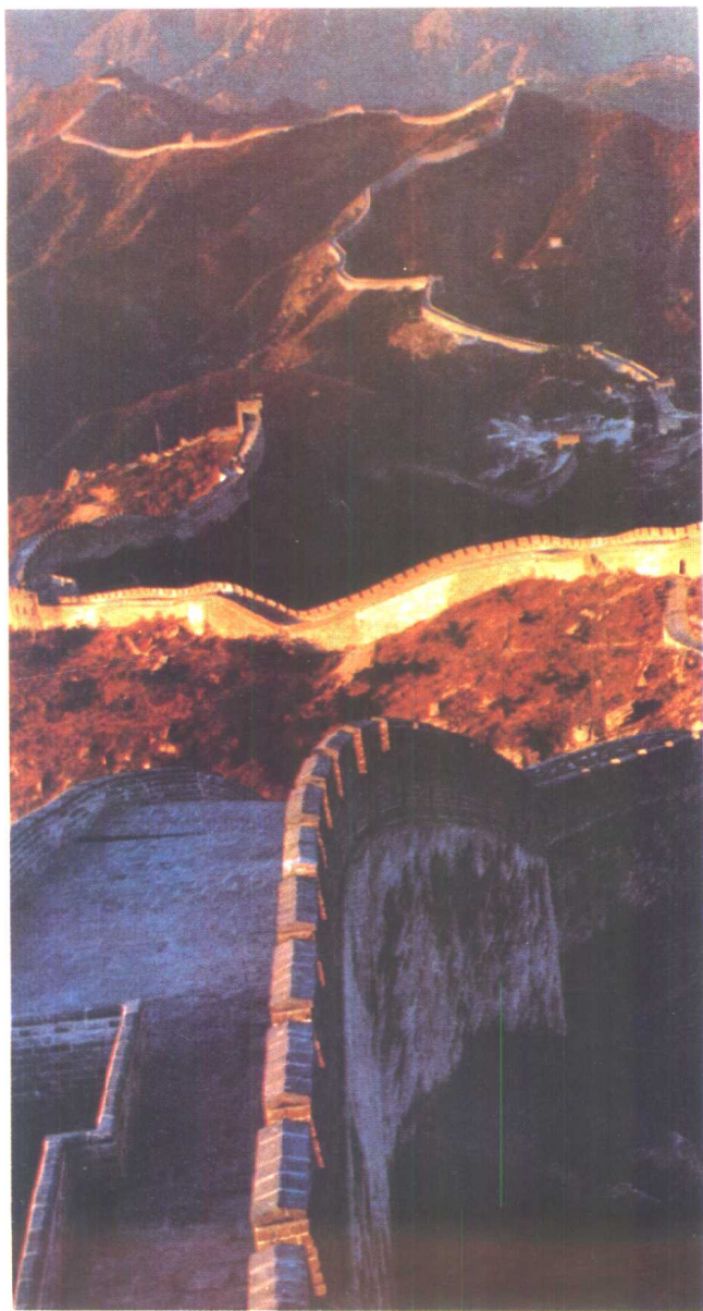
万里长城—中华民族的象征