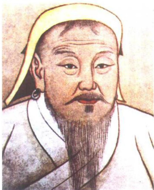
成吉思汗 (1162—1227), 中国古代蒙古族杰出的首领, 军事家和政治家。