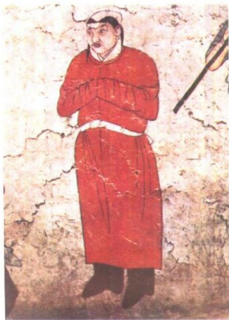
东胡及东 胡后裔鸟桓、 鲜卑和契丹有 髡头的习俗。 这是内蒙古库 伦旗七号辽墓 壁画的墓主人， 代表了契丹族 的上层人物。