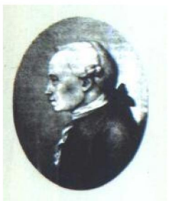
康德(Immanuel Kant, 1724-1804)

德国哲学家，一生在东普鲁士城市哥尼斯堡度过。他的主要著作《纯粹理性批判》对休谟哲学引生的经验主义问题作了全面、综合的回答，为迄今200余年哲学著作的经典。《道德形而上学基础》和《实践理性批判》两部著作集中展示了他的伦理学观点，其中将遵从“绝对命令”作为伦理学的最高原则作了详尽阐述。他的第三部即最后一部批判哲学著作《判断力批判》精妙地论证了审美判断力的普遍性及美的合目的性问题。康德是德国古典哲学的第一个重要代表，其批判哲学对后世哲学影响巨大。